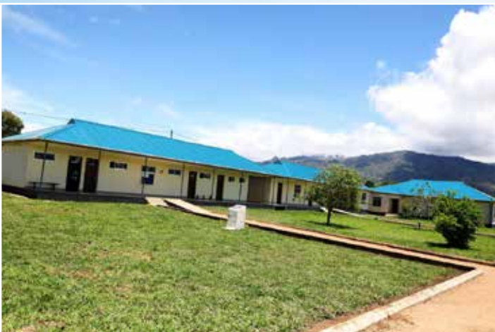
Sehemu ya majengo ya Kituo cha Afya cha Kihagala wilayani Nyasa. Hospitali hii iliwashiwa rasmi umeme na Waziri wa Nishati Dkt Medard Kalemani (hayupo pichani), Desemba 11, 2019.