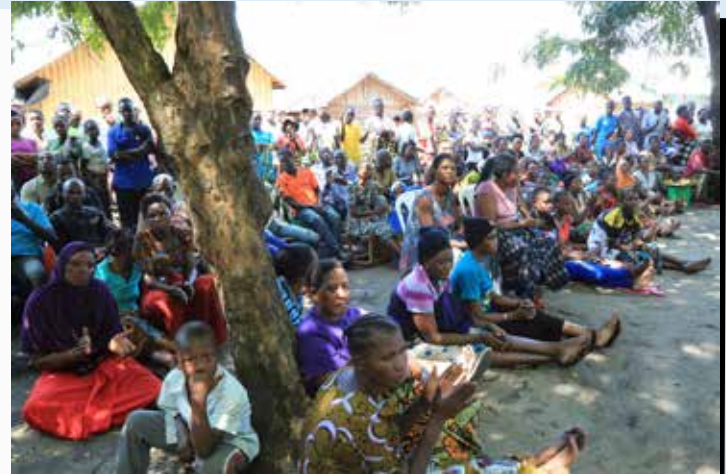
Wakazi wa Kijiji cha Mchangani katika Kisiwa cha Kome wakimsikiliza Naibu Waziri wa Nishati, Subira Mgalu, (hayupo pichani) kuhusu ombi lao la kupatiwa umeme katika makazi yao.