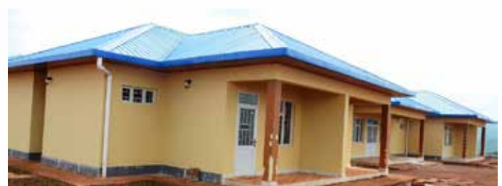
Mwonekano wa miundombinu mbalimbali ya Mradi wa Umeme wa Rusumo. Taswira hizi zilichukuliwa wakati Mawaziri wanaohusika na usimamizi wa Mradi huo kutoka nchi husika za Tanzania, Burundi na Rwanda walipofanya ukaguzi wa maendeleo yake, Desemba 6, 2019.