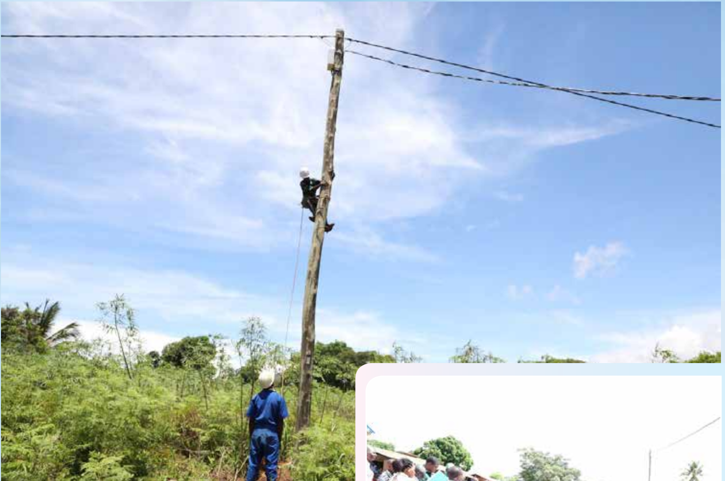
Zoezi la kuunganisha umeme likiendelea katika kijiji cha Kihagala wilayani Nyasa, Mkoa wa Ruvuma. Taswira hii ilinaswa Desemba 11, 2019 wakati Waziri wa Nishati Dkt Medard Kalemani (hayupo pichani), alipofika kijijini hapo kuwasha rasmi umeme.