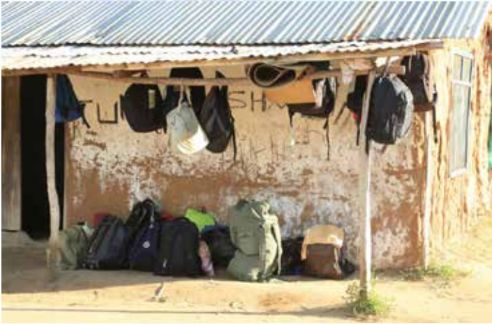
Baadhi ya Mabegi ya vijana na akina mama kutoka mikoa mbalimbali walioweka kambi katika Ofisi ya Kijiji cha Mloka wilayani Rufiji mkoani Pwani, wakisubiri kupata ajira pamoja na fursa za biashara katika ujenzi wa Mradi wa Umeme wa Julius Nyerere, yakiwa yamehifadhiwa nje ya varanda ya moja ya nyumba za wakazi wa kijiji hicho.