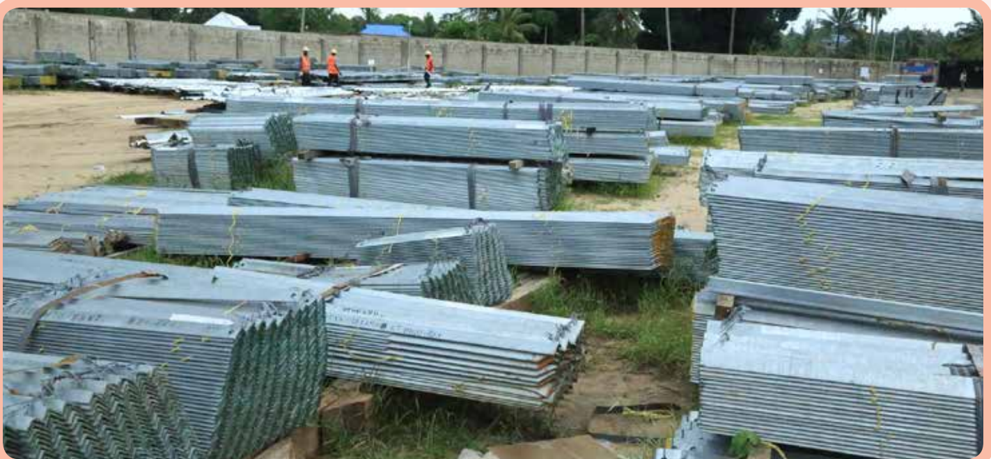
Baadhi ya vifaa vinavyotumika katika ujenzi wa njia ya kusafirisha umeme mkubwa utakaotumika katika reli ya kisasa vilivyohifadhiwa katika ghala lililopo Kibaha mkoani Pwani.