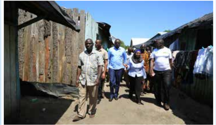
Naibu Waziri wa Nishati, Subira Mgalu (katikati) akipita katika mitaa ya nyumba za wakazi wa Kijiji cha Mchangani, kisiwani Kome, wilayani Sengerema mkoani Mwanza alipotembelea kijiji hicho wakati wa kukagua usambazaji wa umeme vijijini.