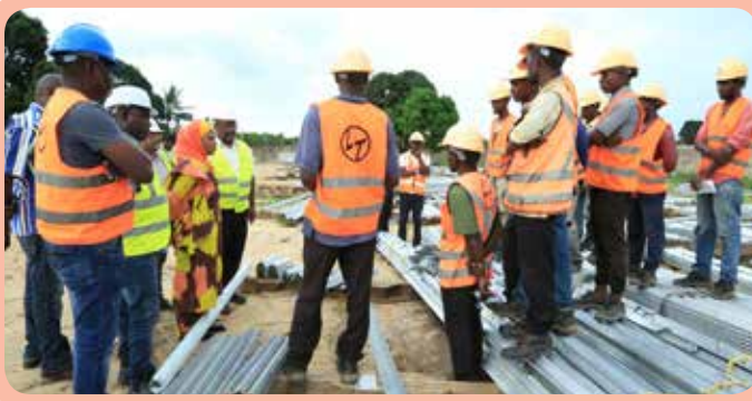
Naibu Waziri wa Nishati, Subira Mgalu, akizungumza na baadhi ya wafanyakazi/vibarua katika ghala la kuhifadhi vifaa vya ujenzi wa njia ya kusafirisha umeme mkubwa utakaotumika katika reli ya kisasa, lililopo Kibaha, mkoani Pwani.