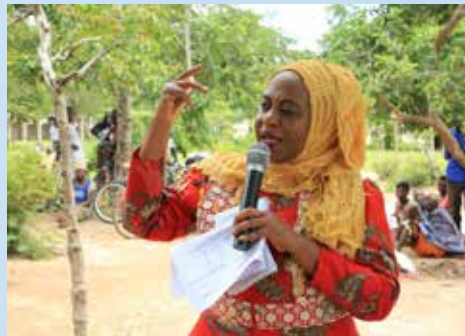
Naibu Waziri wa Nishati, Subira Mgalu, akizungumza na wakazi wa Kijiji cha Buganda, wilayani Ilemela mkoani Mwanza wakati wa kukagua usambazaji wa umeme vijijini.