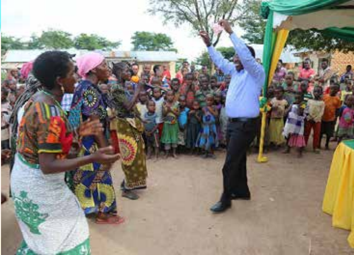
Waziri wa Nishati, Dkt. Medard Kalemani, akitunza moja ya kikundi cha waimbaji cha kijiji cha Kakeneno kabla ya kuwasha umeme katika kijiji hicho.