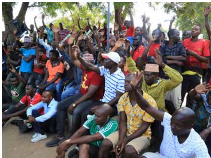
Baadhi ya vijana na akimama kutoka Mikoa mbalimbali nchini walioweke kambi katika Ofisi ya Kijiji cha Mloka wilayani Rufiji mkoani Pwani, wakinyoosha mikono juu kuunga mkono maagizo ya Naibu Waziri wa Nishati, Subira Mgalu, alipofika katika kijiji cha Mloka kusikiliza malalamiko yao ya ajira pamoja na fursa za biashara katika ujenzi wa Mradi wa Umeme wa Julius Nyerere.

Akiwa katika ziara hiyo, Mgalu alishuhudia malori yaliyobeba saruji yakiwa yamesimama huku yakiwa na mizigo, ambapo alieleza kuwa malori hayo yamezuwa kuingia ndani ya eneo la mradi kushusha mizigo wa zaidi ya siku Tano kutokana na kukosa kibali cha kuwaruhusu kuingia