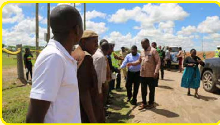
Waziri wa Nishati, Dkt. Medard Kalemani (mwenye shati la bluu) akisalimiana na watumishi mbalimbali wa Mkoa wa Simiyu mara baada ya kufika katika uzinduzi wa Kituo cha Kupokea na Kutawanya Njia kuu za Umeme kilichopo eneo la Ng'amí wilayani Bariadi mkoani humo.

Katika ziara yake mkoani humo, Waziri wa Nishati, alitembelea eneo kutakapojengwa Kituo cha Kupoza Umeme, Imalilo wilayani Bariadi na kuwasha umeme katika kijiji cha Nyasosi kilichopo wilayani humo.