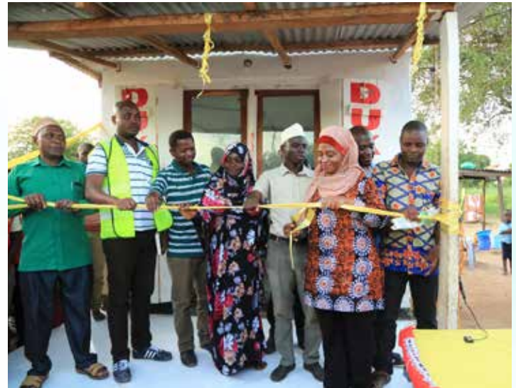
Naibu Waziri wa Nishati, Subira Mgalu (pili kulia) akikata utepe katika moja ya duka la kuuza dawa za Binadamu kuashiria kuwasha umeme katika kijiji cha Kipo, wilayani Rufiji mkoani Pwani.