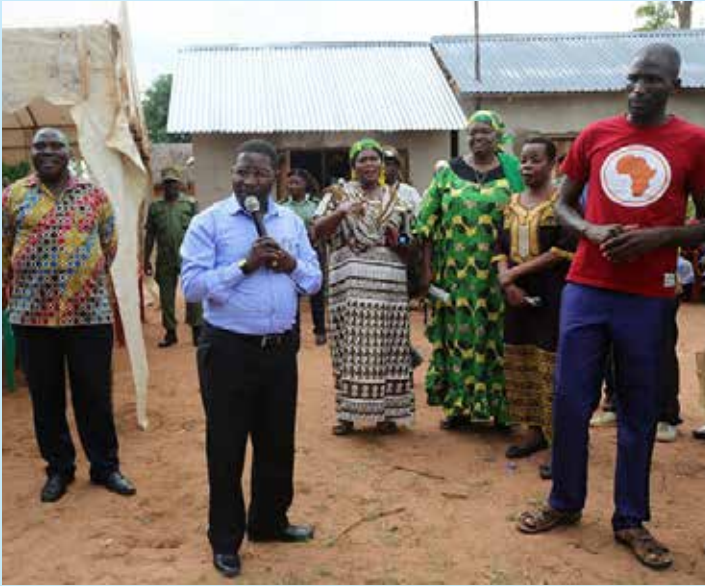
Waziri wa Nishati, Dkt. Medard Kalemami akizungumza na wananchi wa kijiji cha Chemkeni wilayani Kaliua, Mkoa wa Tabora mara baada ya kuwasha umeme kijijini humo.