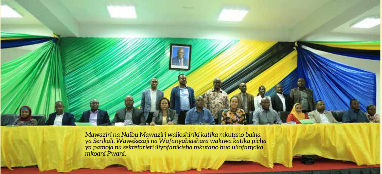
Mawaziri na Naibu Mawaziri walioshiriki katika mkutano baina ya Serikali, Wawekezaji na Wafanyabiashara wakiwa katika picha ya pamoja na sekretarieti iliyofanikisha mkutano huo uliofanyika mkoani Pwani.