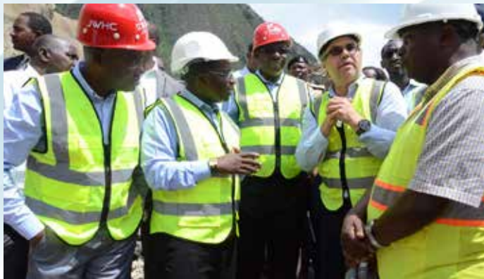
Waziri wa Nishati (Tanzania - wa pili kutoka kushoto) Dkt Medard Kalemami na mawaziri wenzake kutoka Rwanda (Balozi Claver Gatete - wa tatu kutoka kushoto) na Burundi (Mhandisi Come Manirakiza - kushoto), wakikagua na kusikiliza maelezo kuhusu hatua iliyofikiwa katika kutekeleza ujenzi wa mradi huo, Desemba 6, 2019.