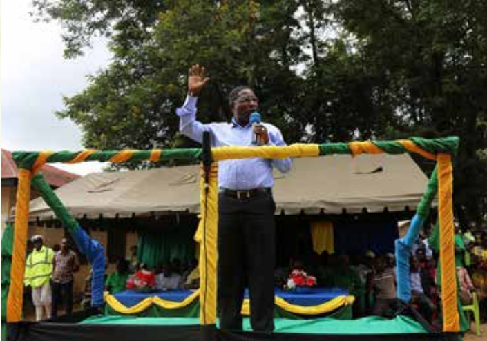
Waziri wa Nishati, Dkt Medard Kalemani akizungumza na wananchi wa Kijiji cha Nguruka wilayani Uvinza, Mkoa wa Kigoma katika mkutano wa hadhara uliofanyika kijiji humo.