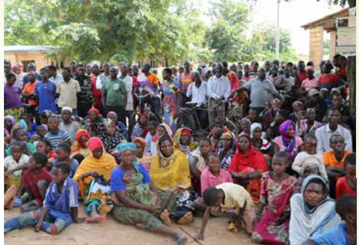
Wananchi wa Kijiji cha Nguruka wilayani Uvinza, Mkoa wa Kigoma wakimsikiliza Waziri wa Nishati, Dkt Medard Kalemani wakati akihutubia kwenye mkutano wa hadhara uliofanyika kijijini humo.