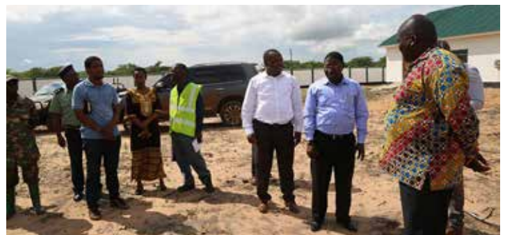
Waziri wa Nishati, Dkt. Medard Kalemani na viongozi mbalimbali wa Wilaya ya Kaliua na Wizara ya Nishati wakiwa katika kituo cha kupoza umeme cha Uhuru kilichopo wilayani Urambo, Mkoa wa Tabora ambacho ujenzi wake unaendelea.