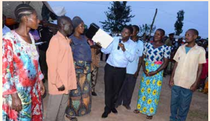
Waziri wa Nishati, Dkt Medard Kalemami, akikabidhi vifaa vya Umeme Tayari (UMETA) kwa wananchi wa kijiji cha Kabukome, wilayani Biharamulo, Mkoa wa Kagera, alipokuwa katika ziara ya kazi, Desemba 5, 2019.

Waziri wa Nishati, Dkt Medard Kalemami akizungumza na wananchi wa kijiji cha Kabukome, wilayani Biharamulo, Mkoa wa Kagera, akiwa katika ziara ya kazi, Desemba 5, 2019.