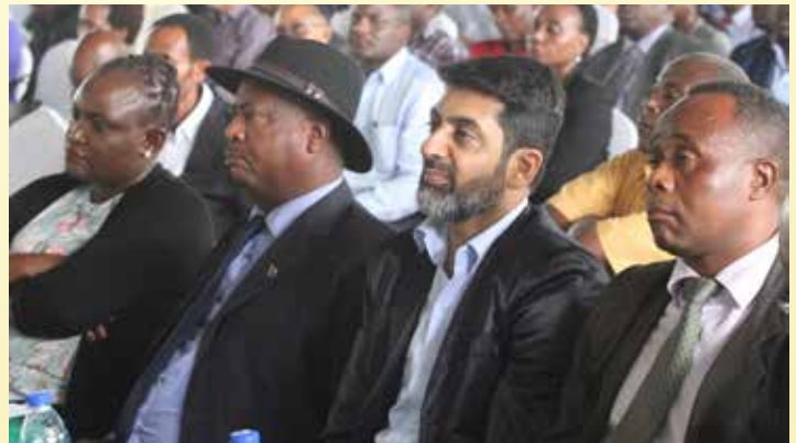
Baadhi ya wawekezaji na wafanyabiashara wakiwasikiliza Mawaziri na Naibu Mawaziri wakati wa mkutano baina ya Serikali, Wawekezaji na Wafanyabiashara uliofanyika Dar es salaam.