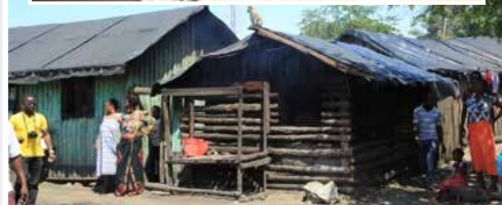
Muonekano wa nyumba za Kijiji cha Mchangani katika hifadhi ya Kisiwa cha Kome, wilayani Sengerema mkoani Mwanza, zinazohitaji kuwekewa umeme.