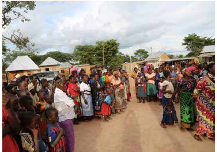
Wananchi wa kijiji cha Kakeneno, kata ya Nyarutembo wilayani Chato wakimsikiliza Waziri wa Nishati, Dkt. Medard Kalemani, (hayupo pichani) wakati alipofika kijijini hapo kuwasha umeme.

Pia aliipongeza Serikali kwa kupeleka umeme katika kijiji hicho, ambacho kabla ya kuwepo kwa umeme kulikuwa na changamoto kubwa kwenye zahanati ambapo baadhi ya wagonjwa walikosa huduma kwa sababu ya kukosekana kwa nishati hiyo, ila kwa sasa huduma zitazidi kuboreka.