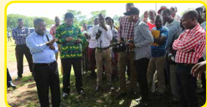
Waziri wa Nishati, Dkt. Medard Kalemani akizungumza na wananchi wa Kijiji cha Nyasosi wilayani Bariadi kabla ya kuwasha umeme katika eneo hilo.