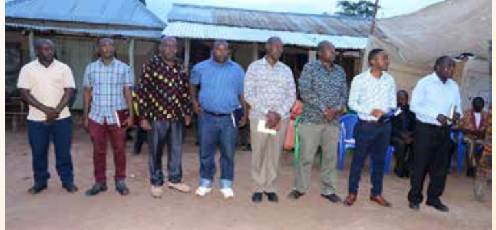
Viongozi mbalimbali kutoka Wizara ya Nishati, Shirika la Umeme Tanzania (TANESCO) na Wakala wa Nishati Vijijini (REA), ambao waliambatana na Waziri wa Nishati Dkt Medard Kalemami (hayupo pichani), katika ziara yake kijijini Kabukome, Wilaya ya Biharamulo, mkoani Kagera, Desemba 5, 2019 wakiwa wamesimama mbele ya wananchi kwa ajili ya utambulisho.