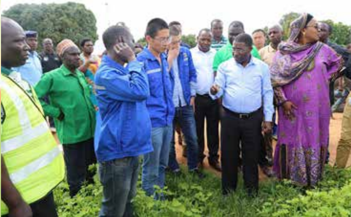
Waziri wa Nishati, Dkt Medard Kalemani akitoa maelekezo kwa wakandarasi wa kampuni ya ETERN-CCCE ambao wameonesha kusuasua katika kazi ya usambazaji umeme mkoani Kigoma.