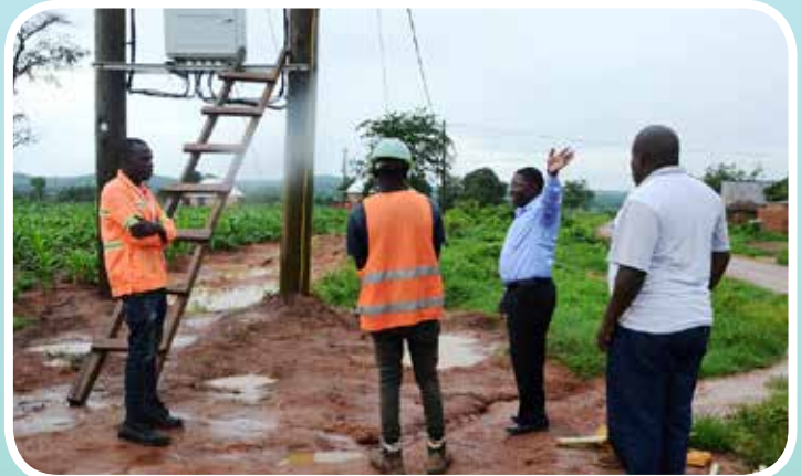
Waziri wa Nishati Dkt Medard Kalemari, akitoa maelekezo kwa wafanyakazi wa mkandarasi wa umeme vijijini, anayetekeleza mradi huo katika kijiji cha Mnekezi, wilayani Chato, Mkoa wa Geita, akiwa katika ziara ya kazi, Desemba 3, 2019. Waziri aliwasha rasmi umeme katika kijiji hicho.