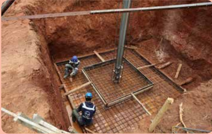
Mafundi wakiendelea na kazi ya kusuka nondo kabla ya kumwaga zege, katika ujenzi wa msingi wa nguzo kubwa ya kusafirisha umeme wa kV 220, utakaotumika katika reli ya kisasa.