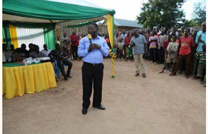
Waziri wa Nishati, Dkt. Medard Kalemani akizungumza na wananchi wa kijiji cha Kakeneno ambao walijitokeza kwa wingi kumsikiliza kiongozi huyo.