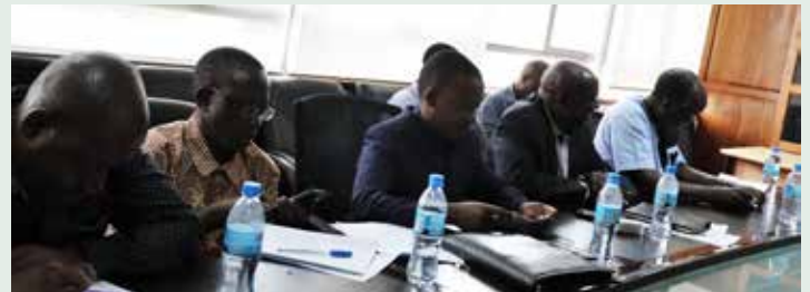
Baadhi ya Wajumbe wa Bodi ya TANESCO, wakiwa kwenye kikao cha uongozi wa Wizara ya Nishati na Bodi hiyo pamoja na Menejimenti ya TANESCO kilichofanyika jijini Dar es Salaam.