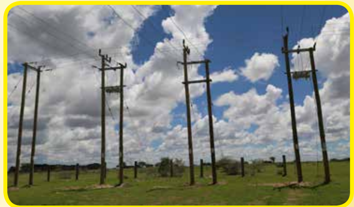
Eneo la Kituo cha Kupokea na Kutawanya Njia kuu za Umeme kilichopo katika eneo la Ng'amí wilayani Bariadi mkoani Simiyu.