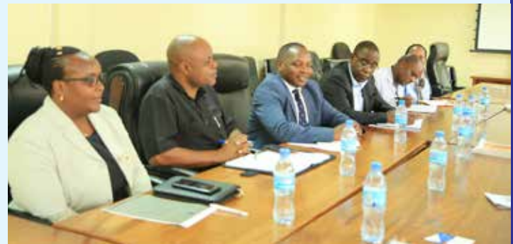
Watendaji Wakuu wa Wizara ya Nishati wakiwa katika majadiliano ya pamoja ya Kituo cha Nishati Jadidifu na Matumizi Bora ya Nishati cha nchi zilizo Kusini mwa Afrika (SACREEE) katika Ofisi ya Wizara ya Nishati Dodoma.