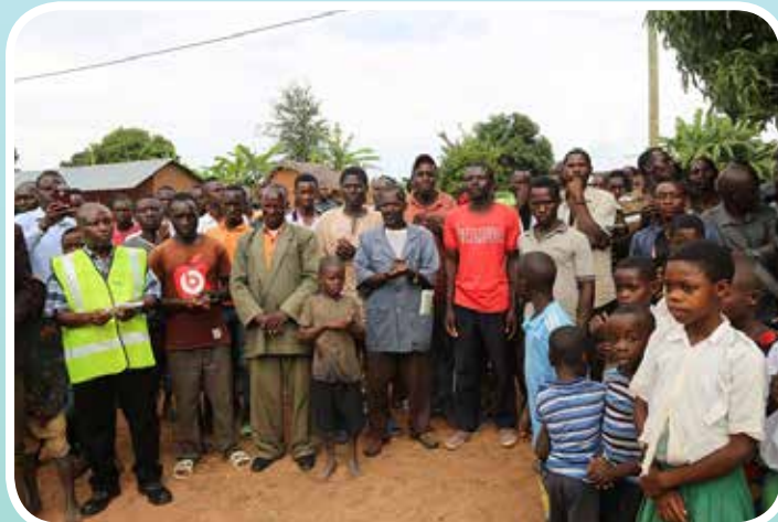
Wananchi wa kijiji cha Chemkeni wilayani Kaliua, Mkoa wa Tabora wakimsikiliza Waziri wa Nishati, Dkt. Medard Kalemami alipokuwa akiwahutubia kijijini humo.