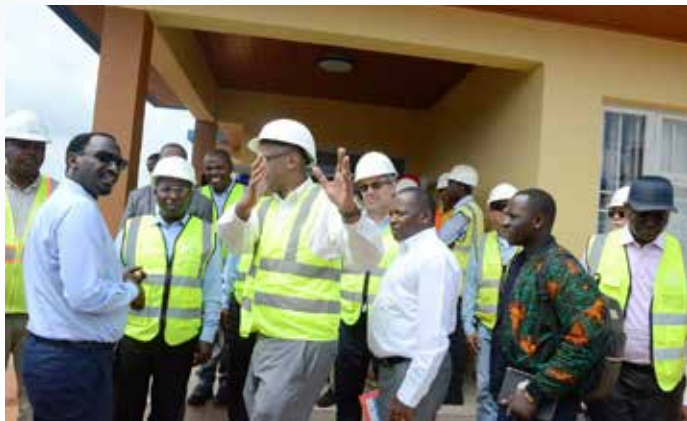
Waziri wa Nishati (Tanzania) Dkt Medard Kalemami na mawaziri wenzake kutoka Rwanda (Balozi Claver Gatete) na Burundi (Mhandisi Come Manirakiza), wakikagua na kusikiliza maelezo kuhusu hatua iliyofikiwa katika kutekeleza ujenzi wa mradi huo, Desemba 6, 2019.