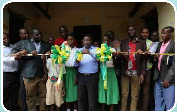
Waziri wa Nishati, Dkt. Medard Kalemami akikata utepe kuashiria kuwasha kwa umeme katika kijiji cha Chemkeni wilayani Kaliua, Mkoa wa Tabora.