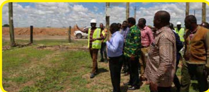
Msimamizi wa cha Kituo cha Kupokea na Kutawanya Njia kuu za Umeme cha Ng'amí, wilayani Bariadi mkoani Simiyu akitoa maelezo kuhusu kituo hicho kwa Waziri wa Nishati Dkt. Medard Kalemani pamoja wageni alioambatana nao.