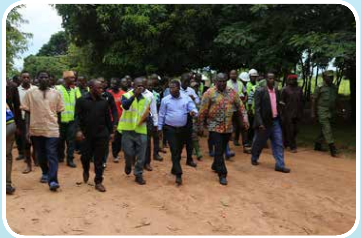
Waziri wa Nishati, Dkt. Medard Kalemami (mwenye shati la bluu) pamoja na viongozi mbalimbali wakielekea kuwasha umeme kwenye shule iliyopo kwenye kijiji cha Chemkeni wilayani Kaliua, Mkoa wa Tabora.

Pia aliwasha umeme katika vijiji vya Ilege, Chemkeni vilivyopo wilayani Kaliua na kukagua ujenzi wa kituo cha kupoza umeme cha Uhuru kilichopo wilaya ya Urambo.