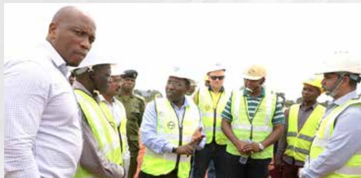
Waziri wa Nishati Dkt Medard Kalemari (katikati), akitoa maelekezo kwa uongozi wa TANESCO na wakandarasi wanaotekeleza mradi wa ujenzi wa kituo cha kupoza umeme Nyakanazi, Februari 25 mwaka huu, alizuru eneo hilo lililopo wilayani Biharamulo kujionea maendeleo yake.

Sambamba na hilo, pia Waziri alisema ni kutokana na imani aliyonayo kwa Mkandarasi husika (M/s