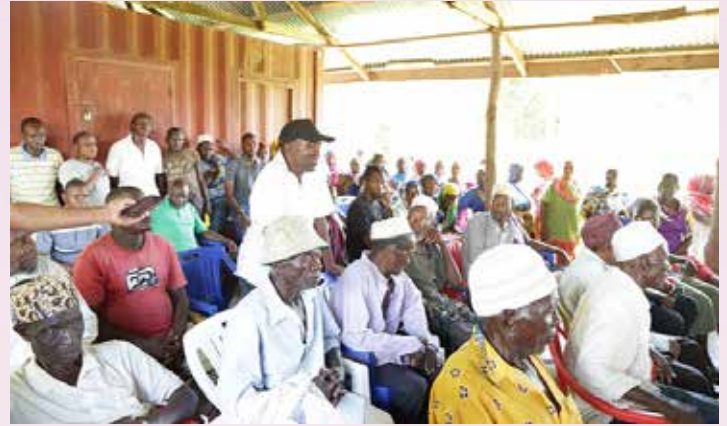
Mkazi wa kijiji cha Matipwili. Kata ya Mkange, Wilaya ya Bagamoyo, Mkoa wa Pwani akitoa maoni kuhusu umeme kwa Naibu Waziri wa Nishati Subira Mgalu (hayupo pichani), wakati wa mkutano wa hadhara uliofanyika kijijini humo hivi karibuni.

Aidha, alimtaaka mkandarasi huyo kukutana na Meneja wa TANESCO Mkoa wa Pwani ili kujadiliana na kuzipitia tena bei za umeme ambazo anazitumia kwa lengo la kupata uwiano wa bei za umeme kwa manufaa ya Watanzania wote.