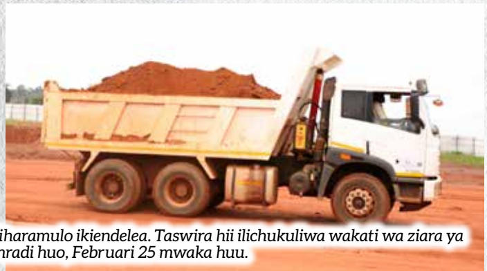
Kazi ya ujenzi wa kituo cha kupoza umeme Nyakanazi wilayani Biharamulo ikiendelea. Taswira hii ilichukuliwa wakati wa ziara ya Waziri wa Nishati Dkt Medard Kalemmani kujionea maendeleo ya mradi huo, Februari 25 mwaka huu.