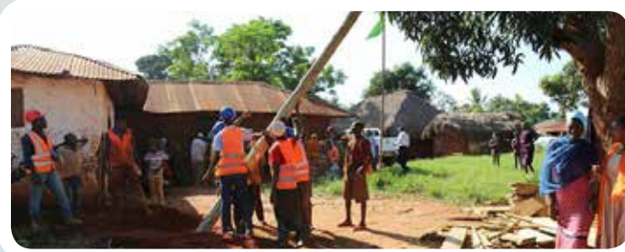
Mafundi wakiwa tayari wameshachimbia nguzo za umeme katika eneo la kata ya Mkange, wilayani Bagamoyo tayari kwa kusambaza umeme. Taswira hii ilichukuliwa wakati wa ziara ya Naibu Waziri wa Nishati hivi karibuni.