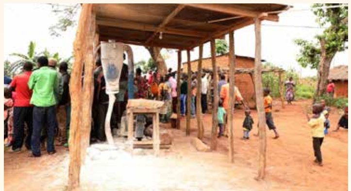
Mashine ndogo ya kusaga nafaka katika kijiji cha Butobela, Kata ya Butengolumasa, wilayani Chato ikiwa imeunganishwa umeme. Taswira hii ilichukuliwa Februari 24, 2020 wakati Waziri wa Nishati Dkt Medard Kalemari (hayupo pichani) alipokuwa akiwasha rasmi umeme eneo hilo.