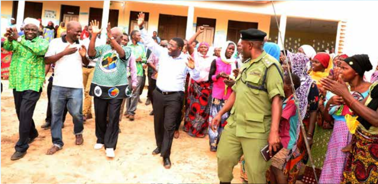
Waziri wa Nishati Dkt Medard Kalemari (katikati) akifurahi pamoja na wananchi baada ya kuwasha umeme katika Zahanati ya kijiji cha Mpenda, Halmashauri ya Mtama, Mkoa wa Lindi, Februari 12, 2020.