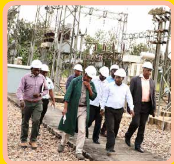
Waziri wa Nishati Dkt Medard Kalemami na Ujumbe wake, wakikagua kituo cha kupoza umeme Kyaka, kilichopo wilayani Misenyi, Mkoa wa Kagera, alipokuwa katika ziara ya kazi Februari 27 mwaka huu.