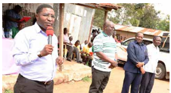
Waziri wa Nishati Dkt Medard Kalemani (kushoto), akiwatambulisha viongozi waandamizi kutoka Shirika la Umeme Tanzania (TANESCO) na Wakala wa Nishati Vijijini (REA), mbele ya wananchi wakati wa hafla ya kuwasha umeme katika kijiji cha Bukamila, wilayani Chato, Februari 22, 2020.