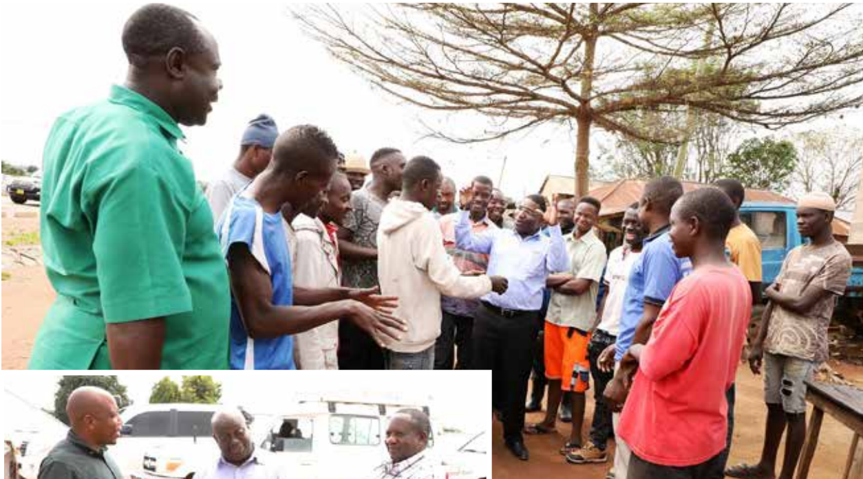
Waziri wa Nishati Dkt Medard Kalemari (katikati), akizungumza na baadhi ya vijana wa kijiji cha Buziku wilayani Chato, Mkoa wa Geita, akiwa katika ziara ya kazi, Februari 21, 2020.