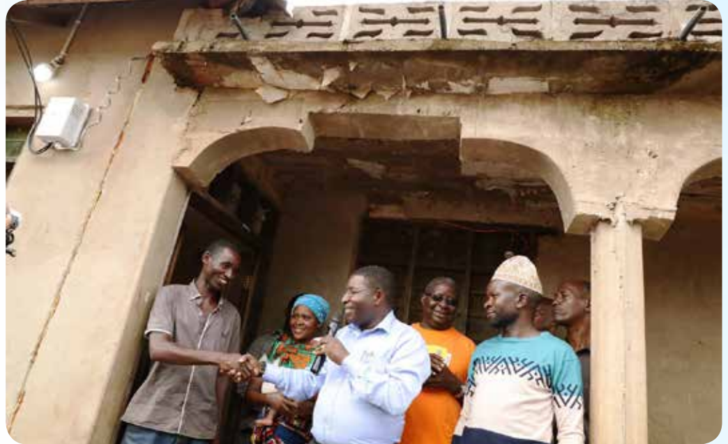
Waziri wa Nishati Dkt Medard Kalemani (katikati), akimpongeza mmoja wa wakazi wa kijiji cha Matogolo, Kata ya Mbuyuni, wilayani Masasi, Mkoa wa Mtwara, baada ya kumuwashia umeme kwenye nyumba yake, Februari 13, 2020.

“Niwe mkweli kuwa, katika mpango wa awali, ni vijiji vichache tu vya Masasi ndivyo vilikuwa vinufaike na mradi huu. Hii ni kwa sababu vijiji vingine viko katika Halmashauri za Miji na siyo Wilaya hivyo vilikuwa