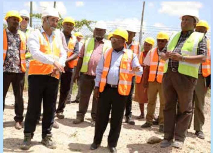
Waziri wa Nishati Dkt Medard Kalemmani (katikati), akitoa maelekezo kwa mkandarasi (Kampuni ya KCE) anayetekeleza mradi wa upanuzi wa kituo cha kupoza umeme Zuzu, Dodoma, alipofanya ziara kukagua maendeleo ya mradi huo, Februari 19, 2020.

Kufuatia umuhimu wa kukamilika kwa mradi huo