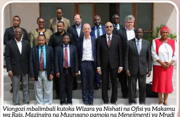
Viongozi mbalimbali kutoka Wizara ya Nishati na Ofisi ya Makamu wa Rais, Mazingira na Muungano pamoja na Menejenti ya Mradi wa Bomba la kusafirisha mafuta ghafi la Afrika Mashariki (EACOP), wakiwa katika picha ya pamoja mara baada ya makabidhiano ya Cheti cha Tathmini ya Athari kwa Mazingira kwa Mradi huo, yaliyofanyika hivi karibuni, Ofisi ya Makamu wa Rais iliyopo Mtumba jijini Dodoma.