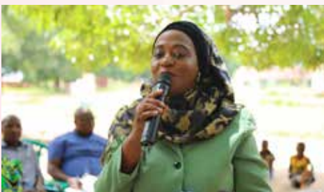
Naibu Waziri wa Nishati Subira Mgalu akizungumza na wananchi wa Kijiji cha Mwenge, Kata ya Kiyanga, Wilaya ya Mtwara vijijini, Mkoa wa Mtwara (hawapo pichani), wakati akiwa kwenye ziara ya kazi kukagua maendeleo ya usambazaji umeme kijijini humo hivi karibuni.

Katika ziara hiyo, Naibu Waziri pia aliwasha umeme katika Kijiji vya Mwenge, Kata ya Kiyanga, Kijiji cha Ushirika Kata ya Mangochapanne na Kijiji cha Kitere Kata ya Kitere, wilayani Mtwara Vijijini.