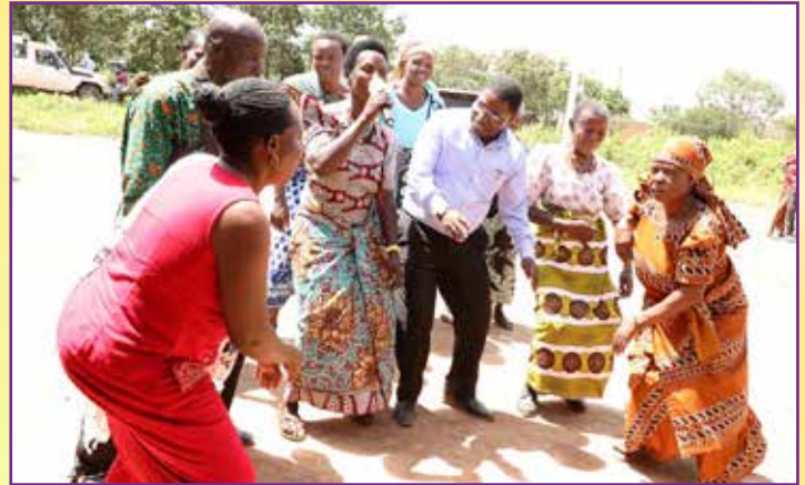
Waziri wa Nishati Dkt Medard Kalemani (mwenye miwani-katikati), akicheza ngoma ya Mlekule na akina mama wa kijiji cha Nyarutefye wilayani Chato, Mkoa wa Geita, wakati wa hafla ya kuwasha rasmi umeme, Februari 21, 2020.