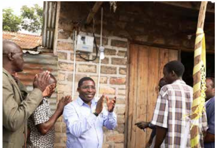
Waziri wa Nishati Dkt Medard Kalemani (katikati), akifurahia mara baada ya kuwasha umeme katika kijiji cha Bukamila, wilayani Chato, Februari 22, 2020.