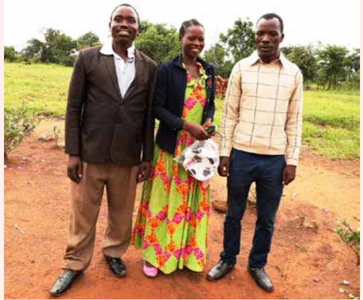
Baadhi ya Walimu wa Shule ya Msingi Tumaini, iliyoopo Kata ya Iparamasa wilayani Chato, wakifuatilia hafla ya uwashaji rasmi umeme shuleni hapo, Februari 24, 2020 ambapo Mgeni Rasmi alikuwa Waziri wa Nishati Dkt Medard Kalemari (hayupo pichani).

Katika ziara hiyo, Waziri pia aliwasha umeme kwenye taasisi mbalimbali za umma na makazi ya wananchi katika vijiji vya Butobela na Mwendakulima vilivyopo Kata ya Butengolumasa.