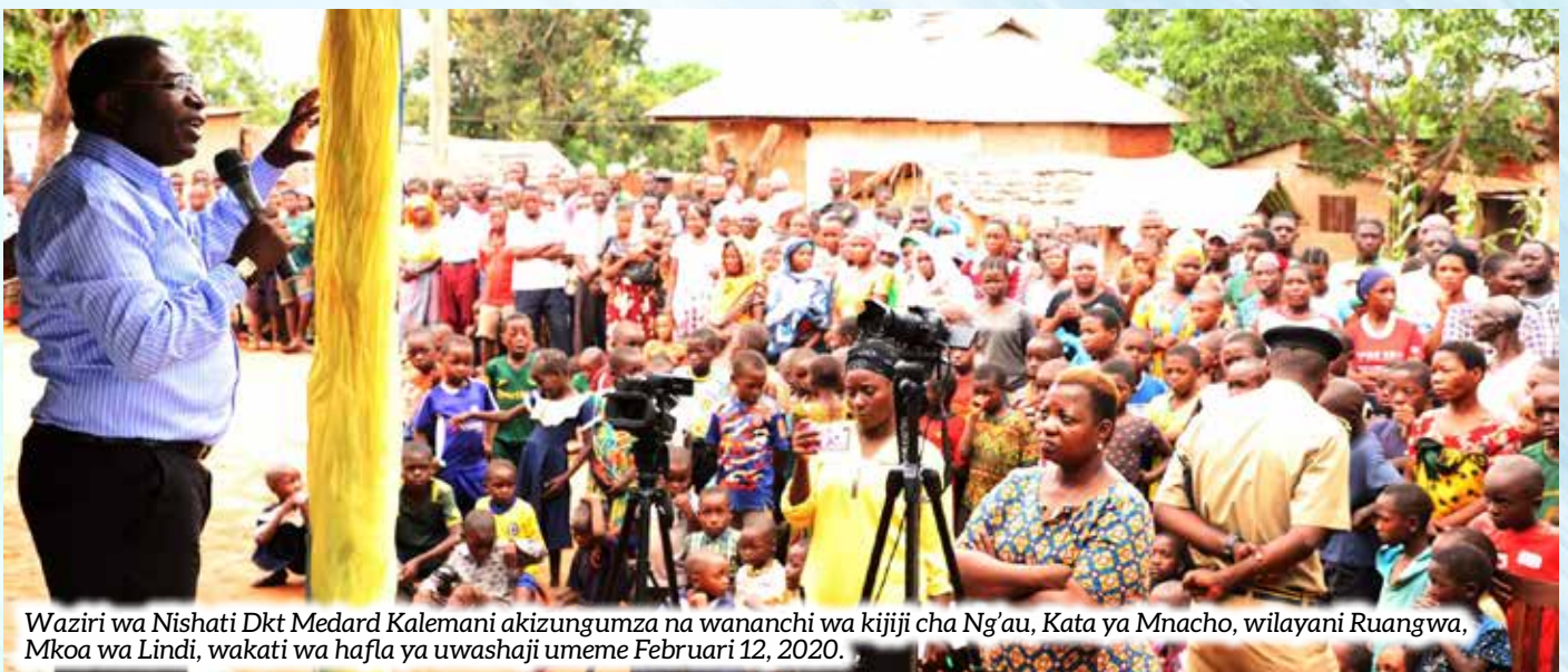
Waziri wa Nishati Dkt Medard Kalemari akizungumza na wananchi wa kijiji cha Ng'au, Kata ya Mnacho, wilayani Ruangwa, Mkoa wa Lindi, wakati wa hafla ya uwashaji umeme Februari 12, 2020.