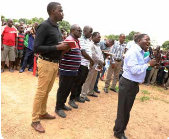
Waziri wa Nishati Dkt Medard Kalemmani, akiwatambulisha kwa wananchi, viongozi na wataalamu mbalimbali kutoka wizarani, Shirika la Umeme Tanzania (TANESCO) na Wakala wa Nishati Vijijini (REA), wakati wa hafla ya uwashaji rasmi umeme katika kijiji cha Nagaga, wilayani Masasi, Mkoa wa Mtwara, Februari 13, 2020.