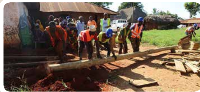
Mafundi wakiwa wanaendelea na kazi ya uwekaji nguzo za umeme, kata ya Mkange, Wilaya ya Bagamoyo, Mkoa wa Pwani, wakati wa ziara ya Naibu Waziri wa Nishati, Subira Mgalu (hayupo pichani), hivi karibuni.

"Mmeona tumepita katikati ya mbuga. Mtakapokwenda kwenye taratibu za manunuzi msituletee wakandarasi wababaishaji. Tunataka wakandarasi wenye uwezo wa kuhimili maeneo kama hayo. Hatutaki mkandarasi ambaye atasema mvua inanyesha gari haipitiki," alisisitiza.