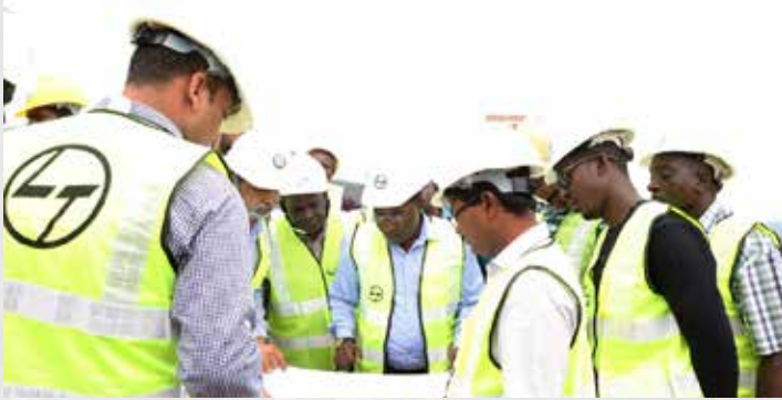
Waziri wa Nishati Dkt Medard Kalemari (katikati), akiangalia mchoro wa ramani ya kituo cha kupoza umeme kinachojengwa Nyakanazi, wilayani Biharamulo alipotembelea eneo hilo Februari 25, kukagua maendeleo ya ujenzi wa mradi husika.