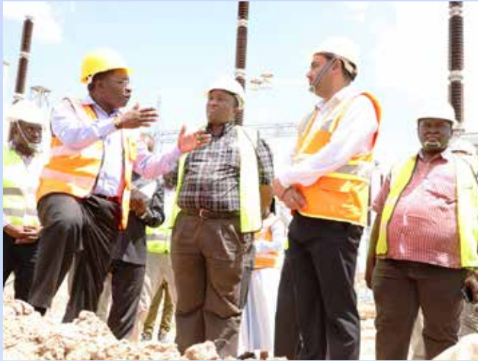
Waziri wa Nishati Dkt Medard Kalemmani (kushoto), akitoa maelekezo kwa mkandarasi (Kampuni ya KCE) anayetekeleza mradi wa upanuzi wa kituo cha kupoza umeme Zuzu, Dodoma, alipofanya ziara kukagua maendeleo ya mradi huo, Februari 19, 2020.

mapema, Waziri alimtaaka mkandarasi anayetekeleza mradi huo, kampuni ya KCE kutoka India, kufanya kazi usiku na mchana ili akamilishe kazi kwa wakati huku akisisitiza kuwa kamwe hataongezewa muda.