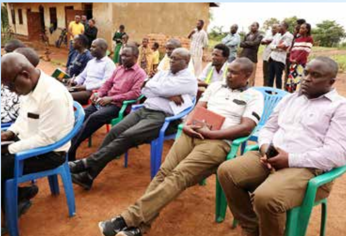
Waziri wa Nishati Dkt Medard Kalemari (kulia), akizungumza na wananchi wanaoishi jirani na kituo cha kupoza umeme Zuzu Dodoma, alipokuwa katika ziara kukagua maendeleo ya mradi wa upanuzi wa kituo hicho, Februari 19, 2020.