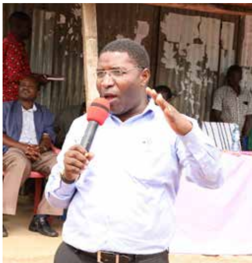
Waziri wa Nishati Dkt Medard Kalemani akizungumza wakati wa hafla ya kuwasha umeme katika kijiji cha Bukamila, wilayani Chato, Februari 22, 2020.