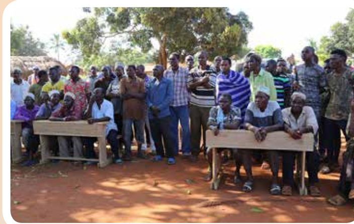
Wananchi wa kata ya Mkange, wilayani Bagamoyo wakimsikiliza Naibu Waziri wa Nishati Subira Mgalu (hayupo pichani) wakati wa mkutano wa hadhara uliofanyika kwenye kata hiyo, hivi karibuni.

Wakizungumza kwa nyakati tofauti, wakazi wa eneo hilo waliishukuru serikali kwa kuona umuhimu wa kuwaletea umeme kwenye kata yao na kuongeza kuwa utawasaidia kwa matumizi mbalimbali hasa katika huduma za jamii.