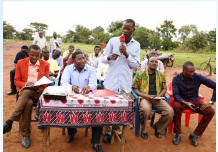
Baadhi ya viongozi waandamizi na wataalamu kutoka Wizarani, Shirika la Umeme Tanzania (TANESCO) na Wakala wa Nishati Vijijini (REA), wakifuatilia hafla ya uwashaji rasmi umeme katika Shule ya Msingi Tumaini iliyopo Kata ya Iparamasa, wilayani Chato, Februari 24, 2020 ambapo Mgeni Rasmi alikuwa Waziri wa Nishati Dkt Medard Kalemari (hayupo pichani).