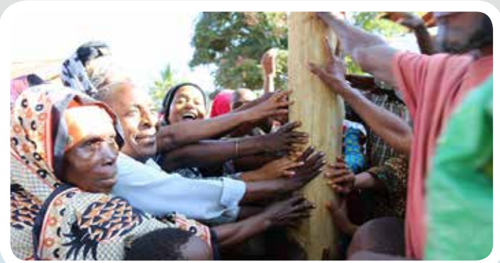
Naibu Waziri wa Nishati Subira Mgalu na wananchi wa Kata ya Mkange, wilayani Bagamoyo, wakiwa wameshika nguzo za umeme kuashiria kufika kwa nishati ya umeme katika eneo hilo hivi karibuni.