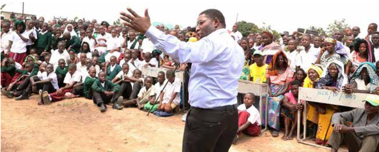
Waziri wa Nishati Dkt Medard Kalemari, akizungumza na wananchi wa kijiji cha Rwantaba, wilayani Chato, Mkoa wa Geita, wakati wa hafla ya kuwasha rasmi umeme kijijini hapo, Februari 21, 2020.