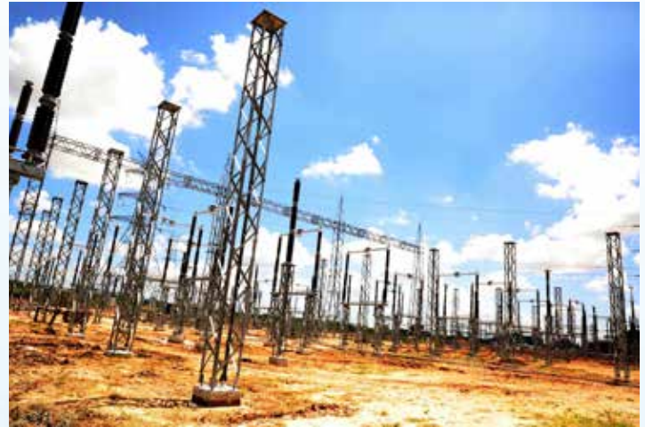
Taswira mbalimbali zikionesha hatua iliyofikiwa katika kutekeleza mradi wa upanuzi wa kituo cha kupoza umeme Zuzu, Dodoma. Taswira hizi zilinaswa Februari 19, 2020 wakati wa ziara ya Waziri wa Nishati Dkt Medard Kalemari (hayupo pichani).