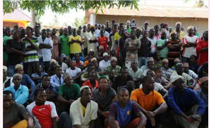
Wananchi wa Kijiji cha Ushirika, Kata ya Mangochapanne wakimsikiliza Naibu Waziri wa Nishati, Subira Mgalu (hayupo pichani) alipokuwa akizungumza nao katika mkutano wa hadhara uliofanyika kijijini humo hivi karibuni.