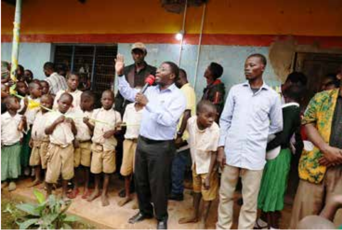
Waziri wa Nishati Dkt Medard Kalemari, akiwaasa wanafunzi na walimu wa Shule ya Msingi Tumaini, iliyoopo Kata ya Iparamasa wilayani Chato, kutumia umeme kuboresha taaluma baada ya kuwasha rasmi nishati hiyo shuleni hapo Februari 24, 2020 akiwa katika ziara ya kazi.