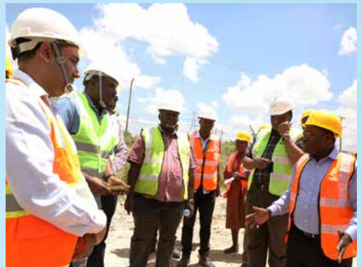
Waziri wa Nishati Dkt Medard Kalemmani (kulia), akitoa maelekezo kwa mkandarasi (Kampuni ya KCE) anayetekeleza mradi wa upanuzi wa kituo cha kupoza umeme Zuzu, Dodoma, alipofanya ziara kukagua maendeleo ya mradi huo, Februari 19, 2020.