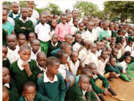
Sehemu ya wanafunzi wa Shule ya Msingi Tumaini, iliyoopo Kata ya Iparamasa wilayani Chato, wakifuatilia hafla ya uwashaji rasmi umeme shuleni hapo, Februari 24, 2020 ambapo Mgeni Rasmi alikuwa Waziri wa Nishati Dkt Medard Kalemari (hayupo pichani).