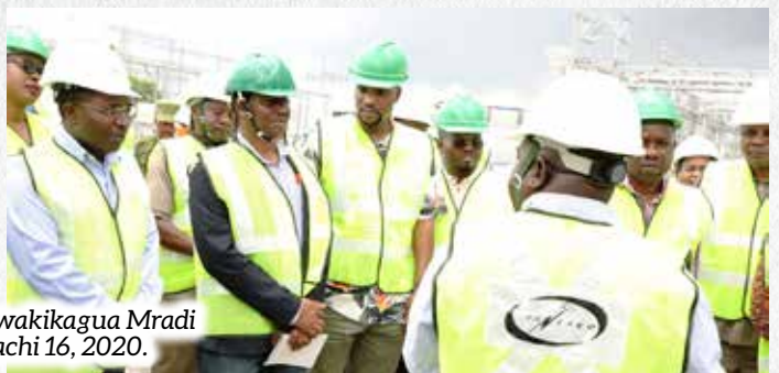
Wajumbe wa Kamati ya Kudumu ya Bunge ya Nishati na Madini, wakikagua Mradi wa Umeme wa Kinyerezi I Extension uliopo jijini Dar es Salaam, Machi 16, 2020.