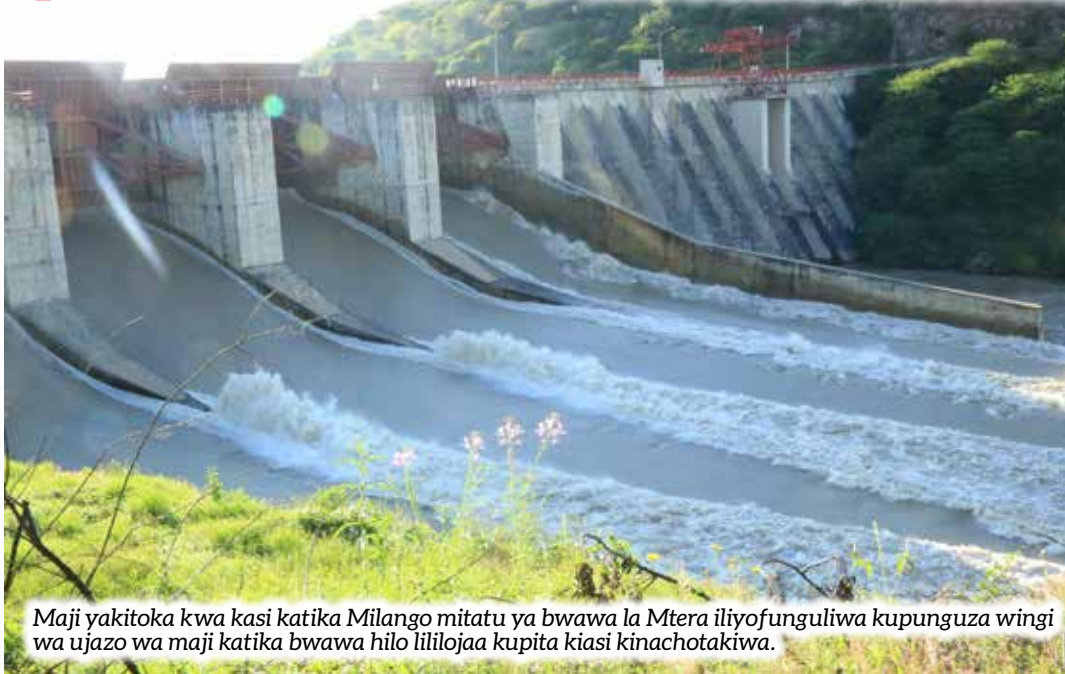
Maji yakitoka kwa kasi katika Milango mitatu ya bwawa la Mtera iliyofunguliwa kupunguza wingi wa ujazo wa maji katika bwawa hilo lililojaa kupita kiasi kinachotakiwa.

ujazo 451.5, maji yalijaa hadi mwisho wa bwawa hilo na kuathiri uzalishaji wa umeme katika mitambo yake, hali iliyosababisha baadhi ya Mikoa inayotumia umeme kutoka kituo hicho kukosa umeme ikiwemo Dodoma, Iringa na Mwanza, lakini Machi 20, 2020 yalipungua na kufika 449.