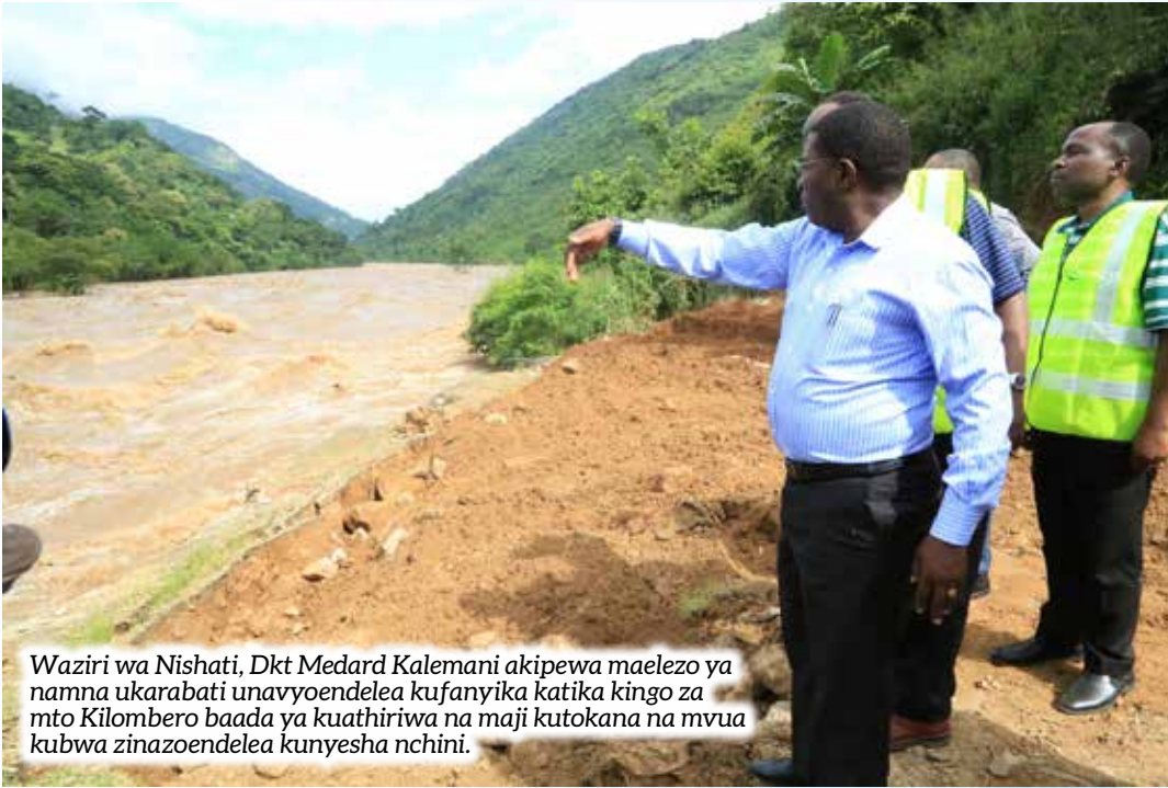
Waziri wa Nishati, Dkt Medard Kalemani akipewa maelezo ya namna ukarabati unavyoendelea kufanyika katika kingo za mto Kilombero baada ya kuathiriwa na maji kutokana na mvua kubwa zinazoendelea kunyesha nchini.