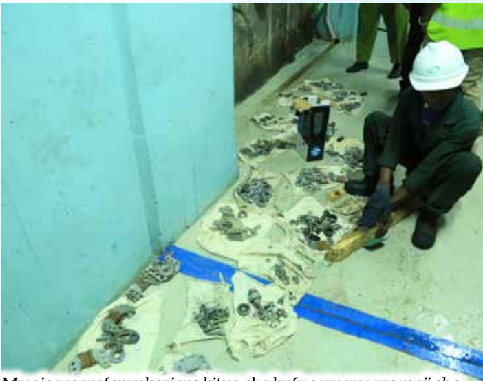
Mmoja wa wafanyakazi wa kituo cha kufua umeme wa maji cha Kidatu akisafisha vipuri vya mashine ya kufua umeme iliyopata hitilafu kutokana na kuzidiwa maji.