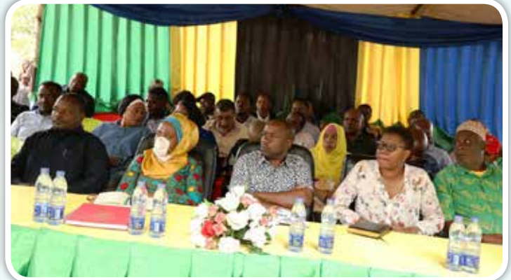
Baadhi ya Wajumbe wa Kamati ya Kudumu ya Bunge ya Nishati na Madini, wakiwa katika hafla ya uwashaji umeme katika Zahanati ya Kijiji cha Kisemvule, Mkuranga, mkoani Pwani, Machi 17 mwaka huu.