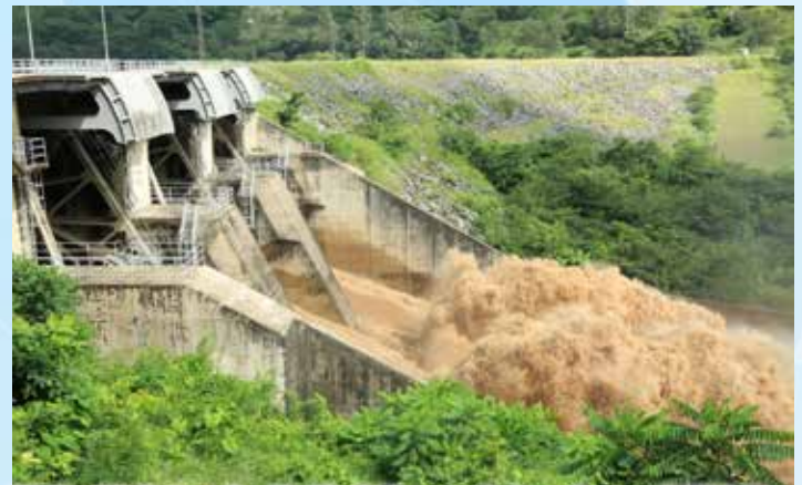
Maji yakitoka kwa kasi katika Milango mitatu ya bwawa la Kidatu iliyofunguliwa kupunguza wingi wa ujazo wa maji katika bwawa hilo.