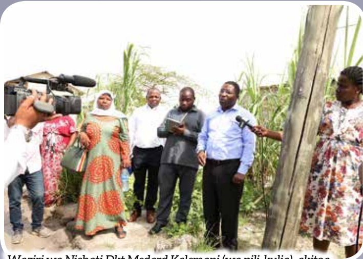
Waziri wa Nishati Dkt Medard Kalemari (wa pili-kulia), akitoa maelekezo mbalimbali kwa Mkandarasi kutoka Kampuni ya Namis Corporate Ltd), anayetokeleza mradi wa Umeme wa Peri-Urban katika Mtaa wa Viwege, Kata ya Majohe, wilayani Ilala, mkoani Dar es Salaam, kufunga nyaya za umeme katika nguzo alizosimika na kuwaunganishia nishati hiyo wananchi wa eneo hilo. Waziri alitoa maagizo hayo Machi 12 mwaka huu, akiwa katika ziara ya kazi.