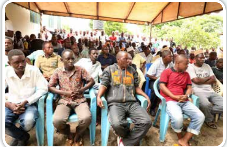
Sehemu ya umati wa wananchi wa kijiji cha Kisemvule, wilayani Mkuranga, Mkoa wa Pwani, wakifuatilia hafla ya uwashaji rasmi umeme katika Zahanati ya kijiji hicho, uliofanywa na Wajumbe wa Kamati ya Kudumu ya Bunge ya Nishati na Madini (hawapo pichani), Machi 17 mwaka huu.