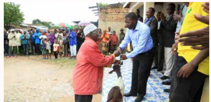
Waziri wa Nishati, Dkt Medard Kalemani (kulia) akipokea zawadi ya mbuzi kutoka kwa mmoja wa wazee wa Kijiji cha Babayu wilayani Chemba, baada ya kukagua maendeleo ya usambazaji umeme katika kijiji hicho hivi karibuni.