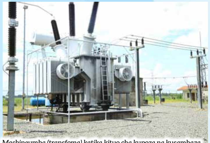
Mashineumba (transfoma) katika kituo cha kupoza na kusambaza umeme cha Kidatu iliyoharibika tangu 2018 ikiwa kituoni hapo ambapo Waziri wa Nishati, Dkt. Medard Kalemari ametoa mwezi mmoja kwa mtu aliyepewa zabuni ya kubadilisha mashine umbwa hiyo kufanya hivyo.