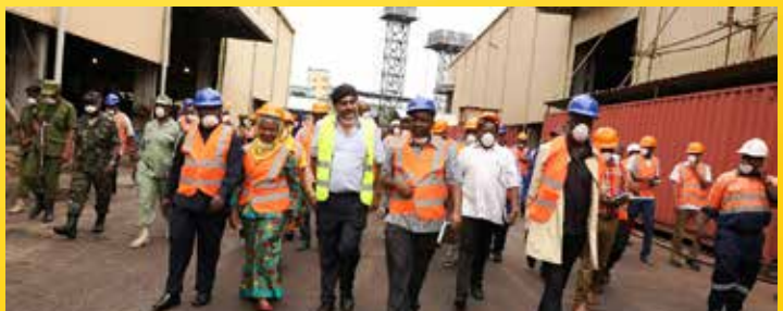
Wajumbe wa Kamati ya Kudumu ya Bunge ya Nishati na Madini wakiwa katika ziara iliyolenga kujionea matumizi ya gesi asilia katika kiwanda cha kufua vyuma cha Lodhia kilichopo Mkuranga mkoani Pwani, Machi 17 mwaka huu.