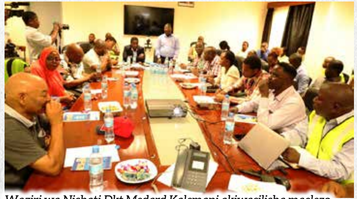
Waziri wa Nishati Dkt Medard Kalemani akiwasilisha maelezo mafupi ya utekelezaji wa Mradi wa Umeme wa Kinyerezi I Extension kwa Wajumbe wa Kamati ya Kudumu ya Bunge ya Nishati na Madini, baada ya kutembelea Mradi huo Machi 16, 2020 jijini Dar es Salaam.