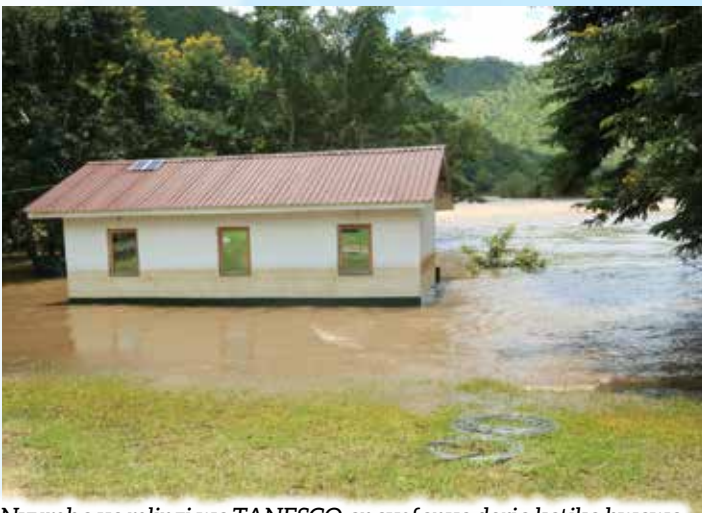
Nyumba ya mlinzi wa TANESCO anayefanya doria katika bwawa la Kidatu katika eneo la Iyovu ikiwa imezingirwa na maji baada ya mto Ruaha Mkuu kufurika maji kutokana na mvua zinazoendelea kunyesha nchini.