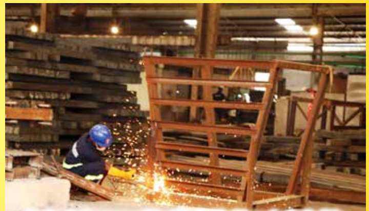
Kazi ya kufua vyuma ikiendelea katika kiwanda cha Lodhia kilichopo Mkuranga, mkoani Pwani. Taswira hii ilichukuliwa wakati wa ziara ya Kamati ya Kudumu ya Bunge ya Nishati na Madini (hawapo pichani) kiwandani hapo, Machi 17 mwaka huu, kwa lengo la kujionea matumizi ya gesi asilia.