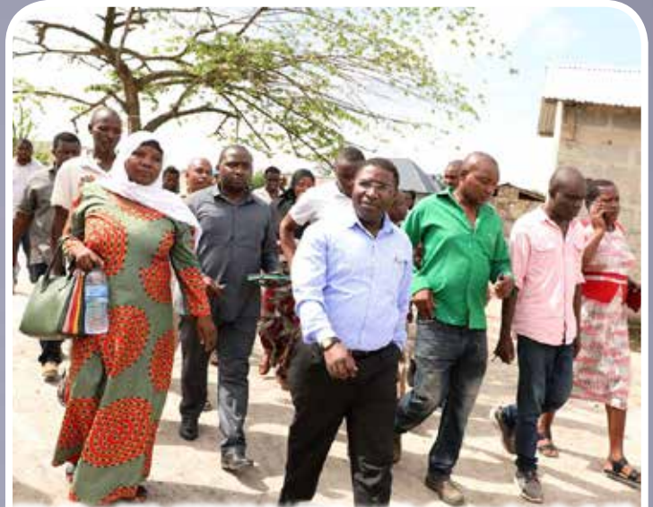
Waziri wa Nishati Dkt Medard Kalemari (mwenye miwani-mbele), akikagua utekelezaji wa Mradi wa Umeme wa Peri-Urban katika Mtaa wa Bombambili, wilayani Ilala, Mkoa wa Dar es Salaam, akiwa katika ziara ya kazi, Machi 12 mwaka huu.