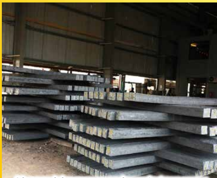
Sehemu ya shehena ya vyuma ambavyo vimetengenezwa na kiwanda cha Lodhia kilichopo Mkuranga mkoani Pwani. Taswira hii ilichukuliwa wakati wa ziara ya Kamati ya Kudumu ya Bunge ya Nishati na Madini (hawapo pichani) kiwandani hapo, Machi 17 mwaka huu, kwa lengo la kujionea matumizi ya gesi asilia.