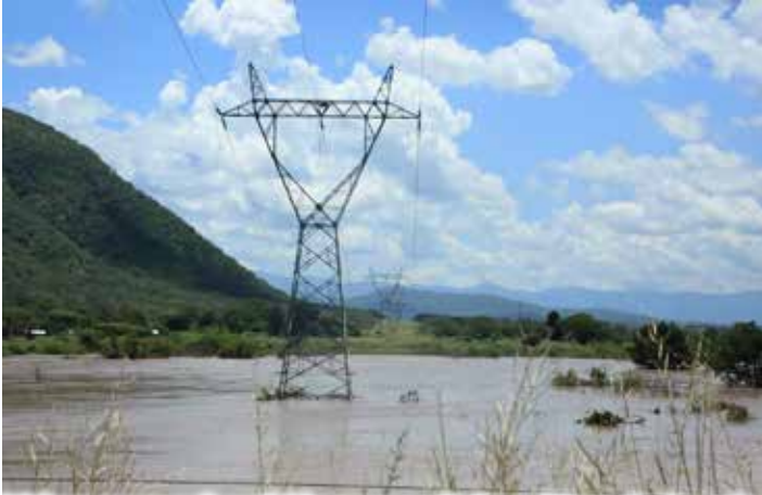
Moja ya nguzo za kusafirisha umeme mkubwa zikiwa ndani ya mto wa Ruaha Mkuu. Awali nguzo hizo zilikuwa mbali na mto huo, lakini kutokana na hali ya mvua nchini mto huo umejaa maji kupita kawaida yake na kuathiri baadhi ya miundombinu.