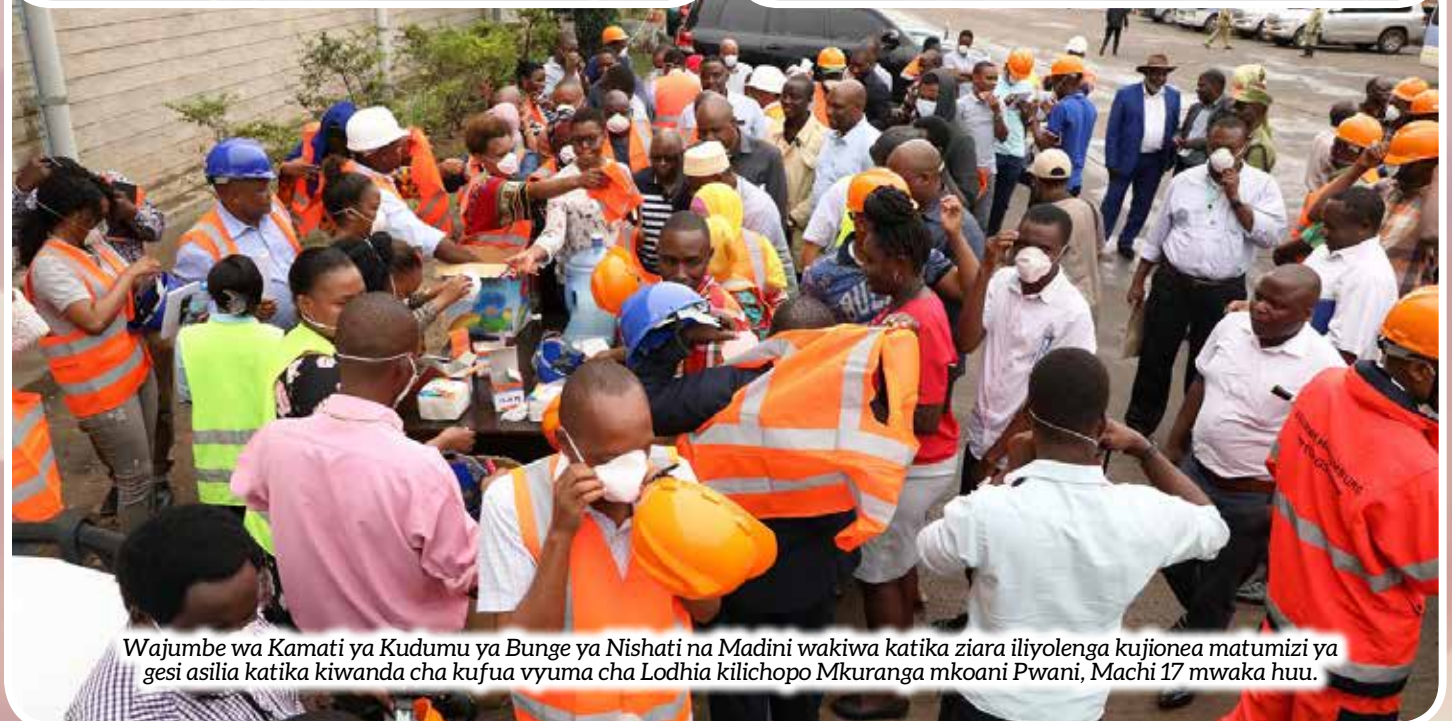
Wajumbe wa Kamati ya Kudumu ya Bunge ya Nishati na Madini wakiwa katika ziara iliyolenga kujionea matumizi ya gesi asilia katika kiwanda cha kufua vyuma cha Lodia kilichopo Mkuranga mkoani Pwani, Machi 17 mwaka huu.