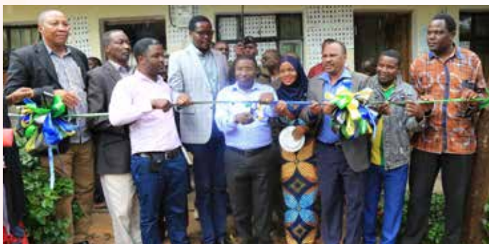
Waziri wa Nishati, Dkt Medard Kalemani (katikati) akiwa katika picha ya pamoja na baadhi ya wazee wa kijiji cha Farkwa waliopewa vifaa vya Umeme Tayari (UMETA), baada ya Waziri kuwasha umeme katika kijiji hicho Wilayani Chemba hivi karibuni.