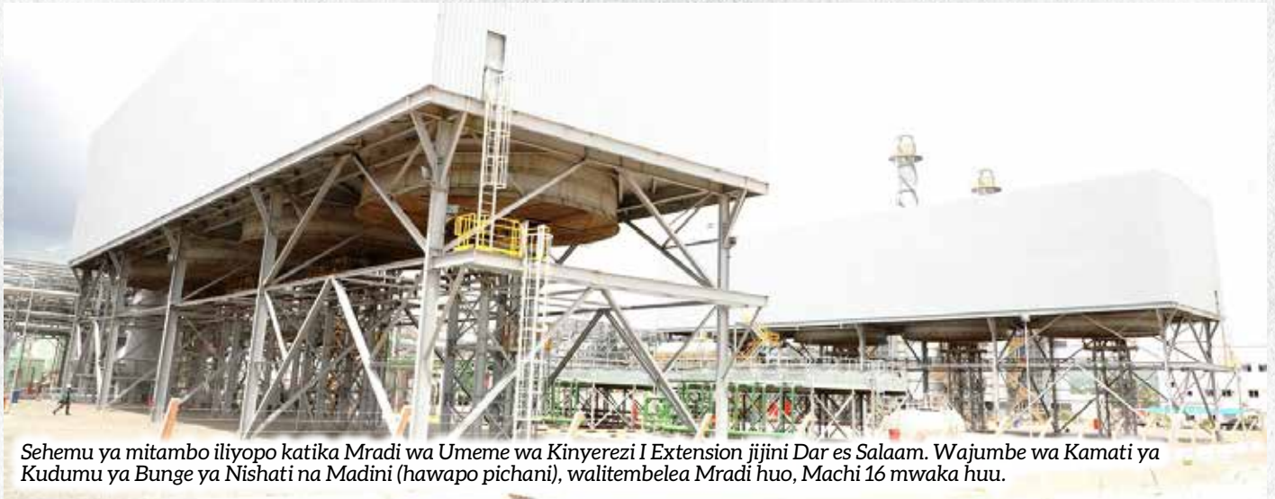
Sehemu ya mitambo iliyopo katika Mradi wa Umeme wa Kinyerezi I Extension jijini Dar es Salaam. Wajumbe wa Kamati ya Kudumu ya Bunge ya Nishati na Madini (hawapo pichani), walitembelea Mradi huo, Machi 16 mwaka huu.