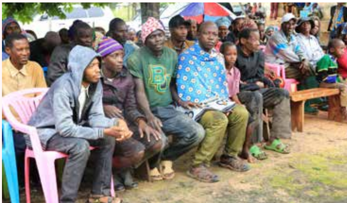
Baadhi ya wakazi wa kijiji cha Farkwa wakimsikiliza Waziri wa Nishati, Dkt Medard Kalemani (hayupo pichani) alipofika katika wilaya hiyo kukagua maendeleo ya usambazaji wa umeme hivi karibuni.