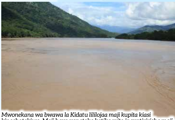
Mwonekana wa bwawa la Kidatu lililojaa maji kupita kiasi kinachotakiwa. Maji hayo yanatoka katika mito inayotiririsha maji mengi ya mvua zinazoendelea kunyesha nchini.

Pia, aliahidi kuwa viongozi hao watatoa ushirikiano katika kudhibiti mafuriko ili yasiathiri uzalishaji wa mitambo hiyo, pamoja na kuunganisha nguvu za kuthibiti maji yanayofunguliwa katika mabwawa ya kuzalisha umeme yasiweze kuathiri jamii na miundombinu kwa ujumla.