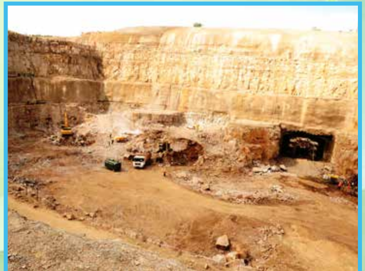
Hatua iliyofikiwa katika ujenzi wa miundombinu mbalimbali katika Mradi wa Umeme wa Julius Nyerere (JNHPP), wakati Waziri wa Nishati Dkt Medard Kalemani (hayupo pichani) alipotembelea Mradi huo Aprili 5, 2020 kwa mara ya 11 tangu kuanza kutekelezwaji wake.