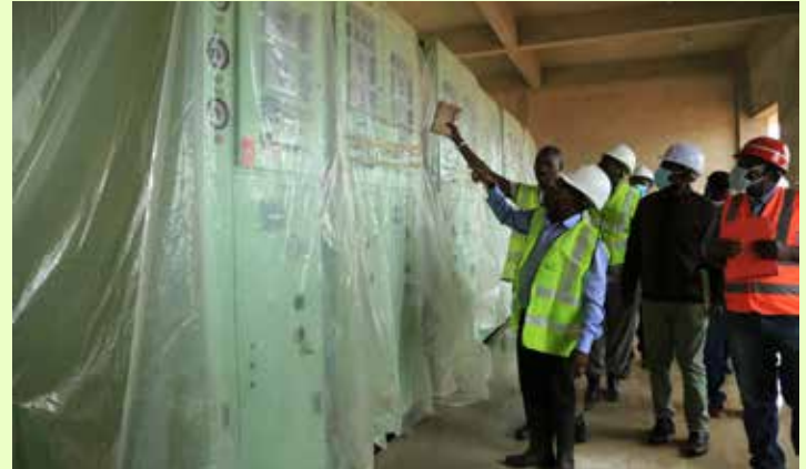
Waziri wa Nishati, Dkt. Medard Kalemani (katikati) akikagua mashine zilizofungwa ndani ya jengo la kuendeshea mitambo (Control Room) katika Kituo cha kupoza na kusambaza umeme cha Mponvu mkoani Geita baada ya kufanya ziara ya kukagua maendeleo ya ujenzi wa kituo hicho hivi karibuni.