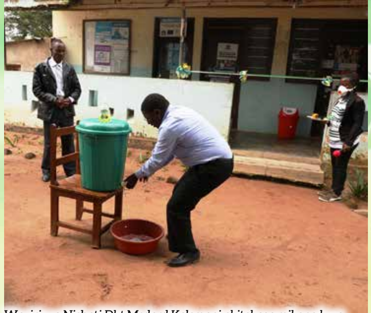
Waziri wa Nishati Dkt Medard Kalemmani akitakasa mikono kwa kunawa alipowasili katika Zahanati ya Kijiji cha Mghamo, Singida Vijijini ambapo aliwasha rasmi umeme akiwa katika ziara ya kazi, Aprili 18 mwaka huu.