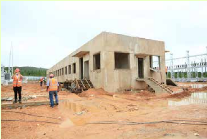
Mwoneko wa jengo la kuendesha mitambo (Control room) katika Kituo cha kupoza na kusambaza umeme cha Mponvu mkoani Geita.