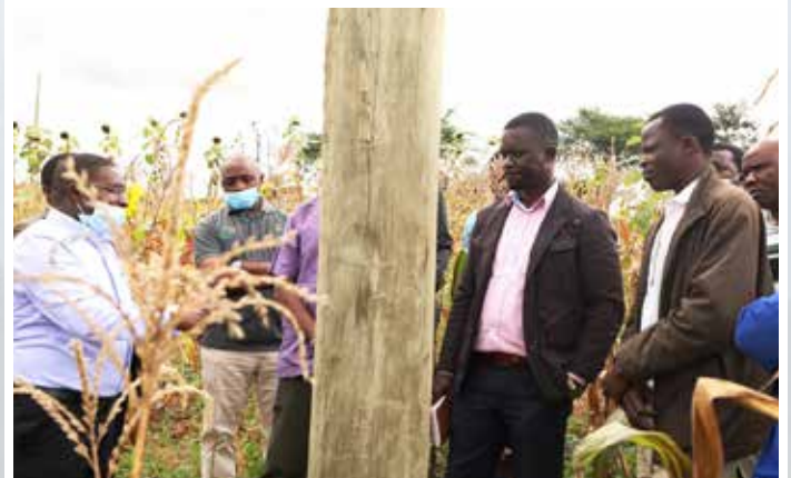
Waziri wa Nishati Dkt Medard Kalemmani (kushoto), akitoa maelekezo kwa watendaji wa Shirika la Umeme Tanzania (TANESCO) na Wakala wa Nishati Vijijini (REA), kumsimamia Mkandarasi anayetokeleza Mradi wa Umeme Vijijini wilayani Iramba, kufunga nyaya za umeme katika nguzo alizosimika katika Kijiji cha Msingi na kuwaunganishia umeme wananchi ndani ya siku saba. Alitoa agizo hilo Aprili 19 mwaka huu.