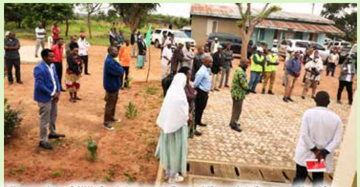
Viongozi wa kijiji cha Mutare, wilayani Ikungi, Mkoa wa Singida, wakiwa wamesimama kwa kuachiana nafasi ili kuchukua tahadhari dhidi ya Corona, wakati wakimsikiliza Waziri wa Nishati Dkt Medard Kalemmani (hayupo pichani), katika tukio la kuwasha umeme katika Zahanati ya kijiji hicho, Aprili 18 mwaka huu.