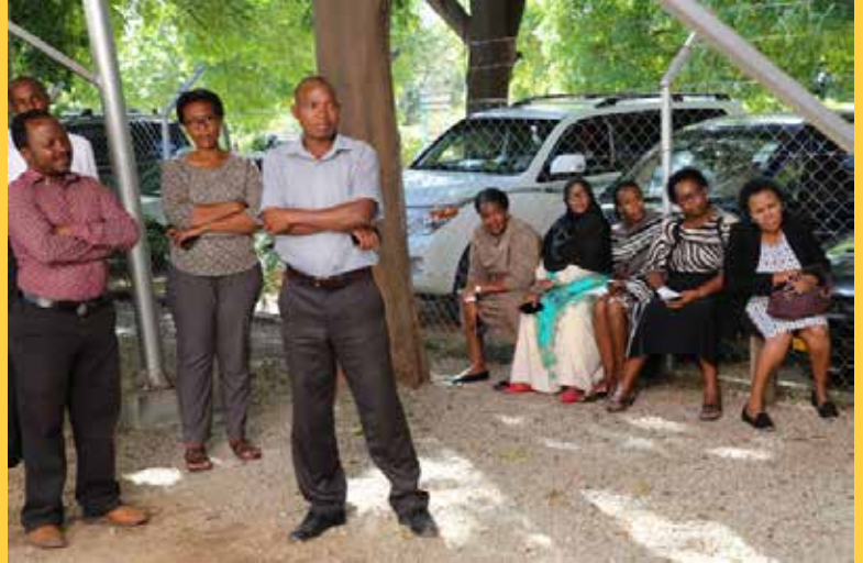
Watumishi wa Wizara ya Nishati wakipata elimu kuhusu ugonjwa wa Covid-19 unaosababishwa na virusi vya Corona. Mafunzo hayo yalifanyika katika Ofisi za Wizara zilizopo Mtumba na Kikuyu jijini Dodoma, Aprili 15 mwaka huu.