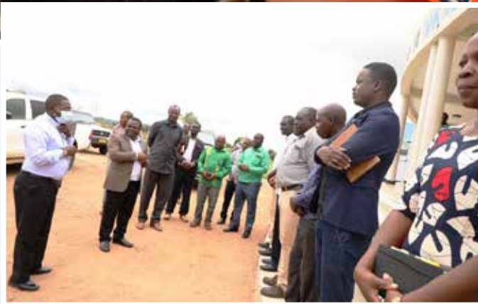
Waziri wa Nishati Dkt Medard Kalemani (wa kwanza kushoto), akisalimiana na viongozi wa Ofisi ya Mkuu wa Wilaya ya Mkalama, alipowasili wilayani humo Aprili 19, 2020 kwa ziara ya kazi kukagua utekezaji wa miradi ya umeme.