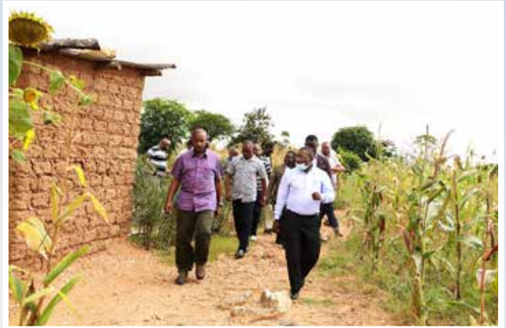
Waziri wa Nishati Dkt Medard Kalemmani (mbele-kulia) akiwa amefuatana na viongozi na watendaji mbalimbali wa Serikali wakati akikagua utekelezaji wa miradi ya umeme vijijini wilayani Mkalama, Mkoa wa Singida, Aprili 19, 2020.

Vilevile, alimwomba Waziri Kalemmani kufikisha salamu za shukrani kwa Rais Magufuli kutokana na upendeleo ambao amekuwa akiwapatia