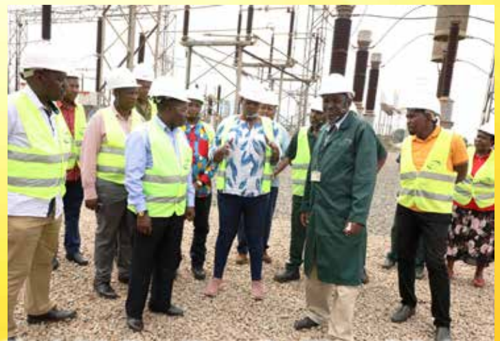
Waziri wa Nishati Dkt Medard Kalemmani na Ujumbe wake wakikagua Kituo cha Kufua Umeme Msamvu, mkoani Morogoro, katika ziara ya kushtukiza, Aprili 4 mwaka huu.