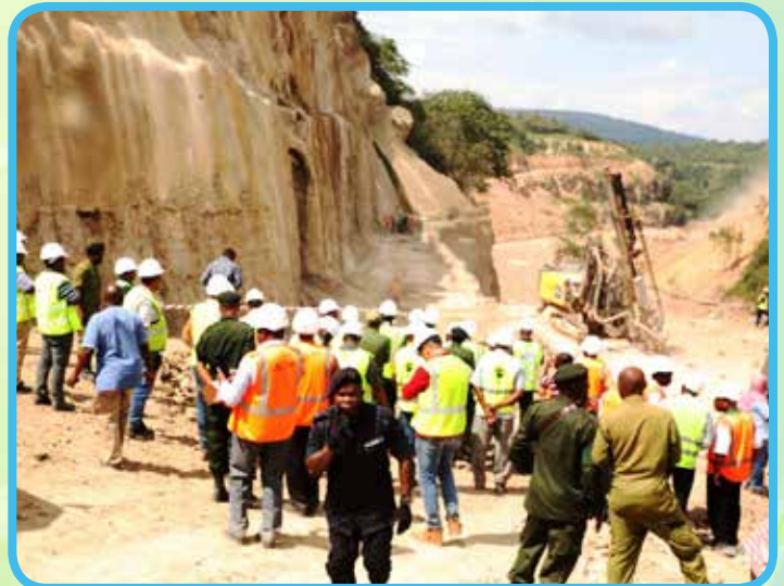
Waziri wa Nishati Dkt Medard Kalemani na Ujumbe wake, wakikagua maendeleo ya Mradi wa Umeme wa Julius Nyerere (JNHPP), Aprili 5 mwaka huu.