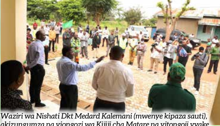
Waziri wa Nishati Dkt Medard Kalemmani (mwenye kipaza sauti), akizungumza na viongozi wa Kijiji cha Matare na vitongoji vyake, baada ya kuwasha rasmi umeme katika Zahanati ya Kijiji hicho kilichopo wilayani Ikungi, Mkoa wa Singida, Aprili 18, 2020. Utaratibu wa sasa wa Waziri akiwa ziarani ni kuzungumza na viongozi pekee ili kuepusha mikusanyiko mikubwa ya wananchi, ikiwa ni utekezaji wa maelekezo ya wataalamu wa afya katika kujikinga na janga la ugonjwa wa Corona.