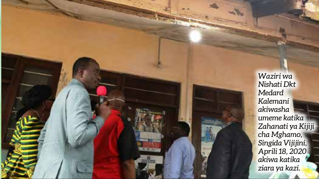
Waziri wa Nishati Dkt Medard Kalemami akiwasha umeme katika Zahanati ya Kijiji cha Mghamo, Singida Vijijini, Aprili 18, 2020 akiwa katika ziara ya kazi.