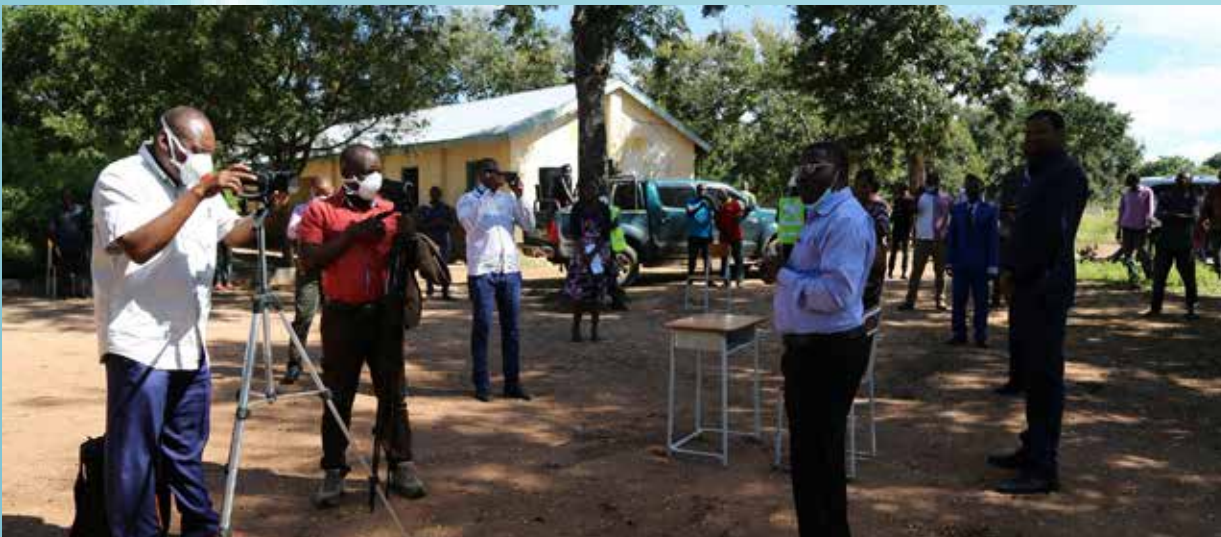
Waziri wa Nishati, Dkt Medard Kalemari (katikati) akizungumza na viongozi wa Kijiji cha Mizanza, Wilaya ya Igunga mkoani Tabora, alipofanya ziara ya kukagua shughuli za usambazaji umeme vjijini, Aprili 27, 2020.