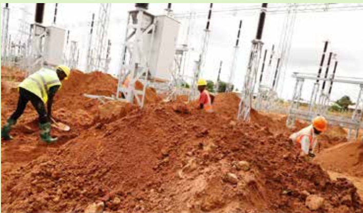
Mafundi wakiendelea na kazi za ujenzi wa kituo cha kupoza umeme Singida. Taswira hii ilichukuliwa wakati wa ziara ya Waziri wa Nishati Dkt Medard Kalemmani (hayupo pichani), Aprili 18, 2020.