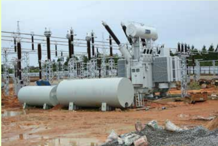
Mwonekano wa sehemu ya mitambo iliyopo katika kituo cha kupoza na kusambaza umeme cha Mponvu kinachotarajiwa kukamilika mwishoni mwa Mwezi Mei, 2020.