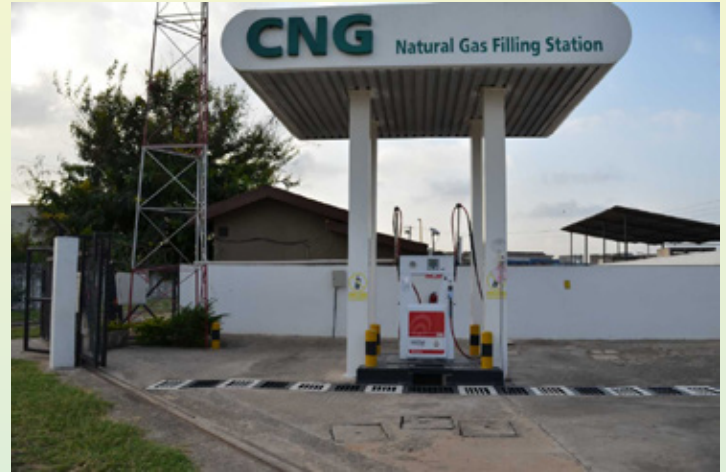
Kituo cha kujaza gesi kwenye magari cha Ubungo jijini Dar es Salaam.