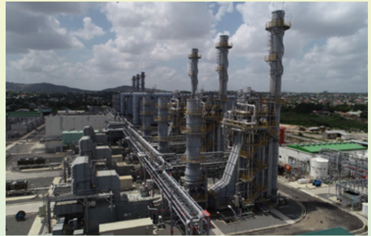
Mitambo ya kufua umeme wa gesi ya Kinyerezi II jijini Dar es Salaam (MW 240).

ya matumizi ya gesi asilia ikilinganishwa na magari 60 yaliyokuwa yameunganishwa mwaka 2015.