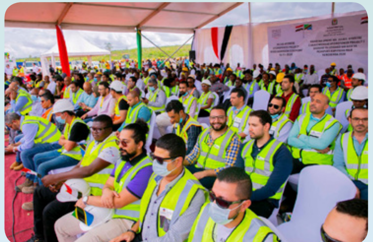
Baadhi ya wageni waliohudhuria uzinduzi wa uchepushaji wa maji ya mto Rufiji kupitia handaki ili kuruhusu ujenzi wa tuta kuu katika mradi wa umeme wa Julius Nyerere (JNHPP).