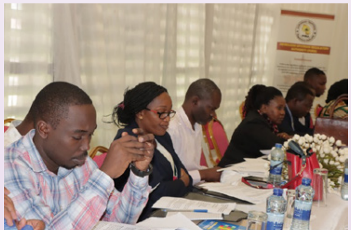
Wafanyakazi wa PURA na Wajumbe wa Baraza la Wafanyakazi wakipitia nyaraka mbalimbali katika uzinduzi wa Baraza la Wafanyakazi PURA.