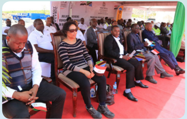
Baadhi ya wajumbe wa Bodi ya Wakurugenzi wa Shirika la Umeme Tanzania (TANESCO) wakimsikiliza Waziri Mkuu, Kassim Majaliwa (hayupo pichani) wakati wa uzinduzi wa uchepushaji wa maji ya mto Rufiji kupitia handaki ili kuruhusu ujenzi wa tuta kuu katika mradi wa umeme wa Julius Nyerere (JNHPP).

Aliwahamasisha wawekezaji kutumia fursa hiyo kuja kuwekeza zaidi nchini kwa kuwa kutakuwa na umeme wa kutosha, wa uhakika na gharama nafuu kuweza kuendesha shughuli za kiuchumi na pia Tanzania ina sera nzuri na bora za kuwavutia wawekezaji katika nyanja mbalimbali za kiuchumi.