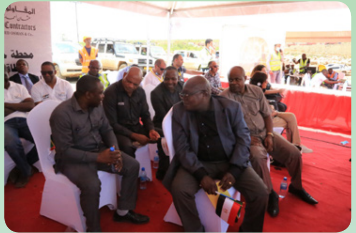
Baadhi ya Viongozi Wakuu wa Wizara ya Nishati, wakibadilishana mawazo wakati wa uzinduzi wa uchepushaji wa maji ya mto Rufiji kupitia handaki ili kuruhusu ujenzi wa tuta kuu katika mradi wa umeme wa Julius Nyerere (JNHPP).