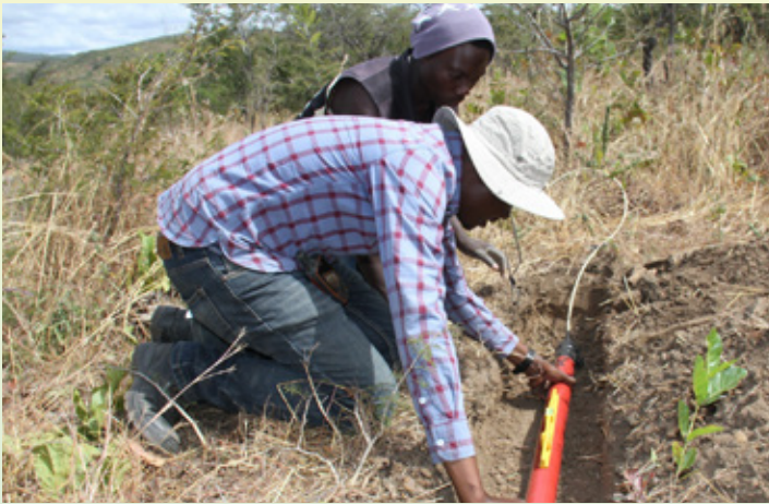
Utafiti wa kijiofizikia katika miradi ya jotoardhi katika mikoa ya Songwe na Mbeya.