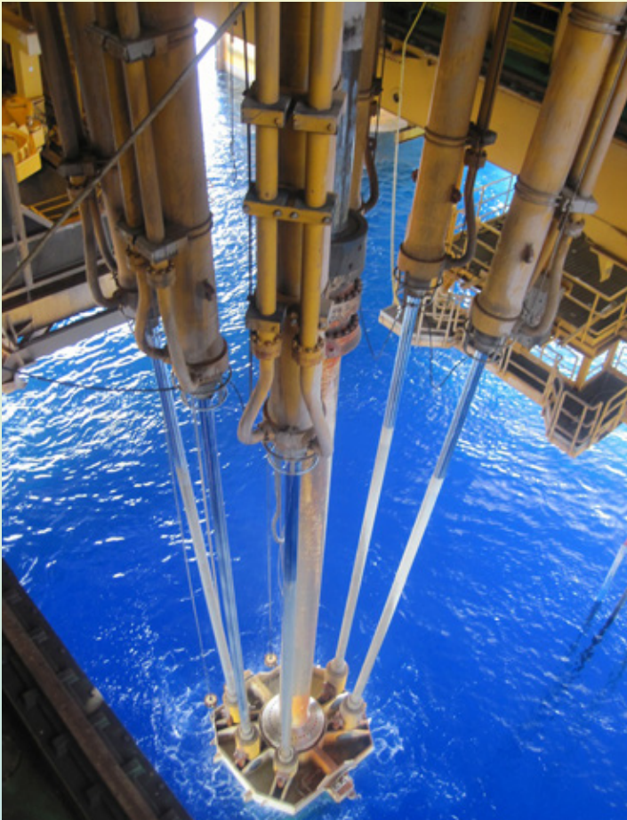
Utafiti wa shughuli za mafuta katika kina kirefu cha maji.

wapatao 3,897 wameajiriwa tangu utekelezaji wa Mradi uanze ambapo kati ya wafanyakazi hao, Watanzania ni 3,422 sawa na asilimia 87.81 na wafanyakazi kutoka nje ya nchi ni 475 sawa na asilimia 12.19 ya wafanyakazi wote wa Mradi. Hadi kukamilika kwa Mradi, Watanzania 6,000 wataajiriwa katika shughuli za Mradi.