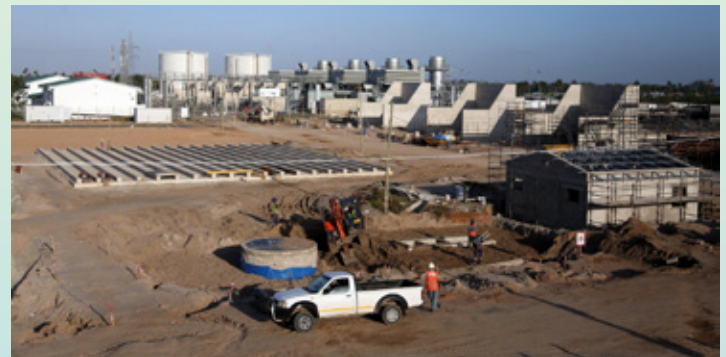
Mwonekano wa baadhi ya miundombinu ya umeme katika mradi wa Kinyerezi I Extension (MW 185).

kutoka asilimia 67.8 mwaka 2016 na kufikia asilimia 78.4 mwezi Aprili, 2020.