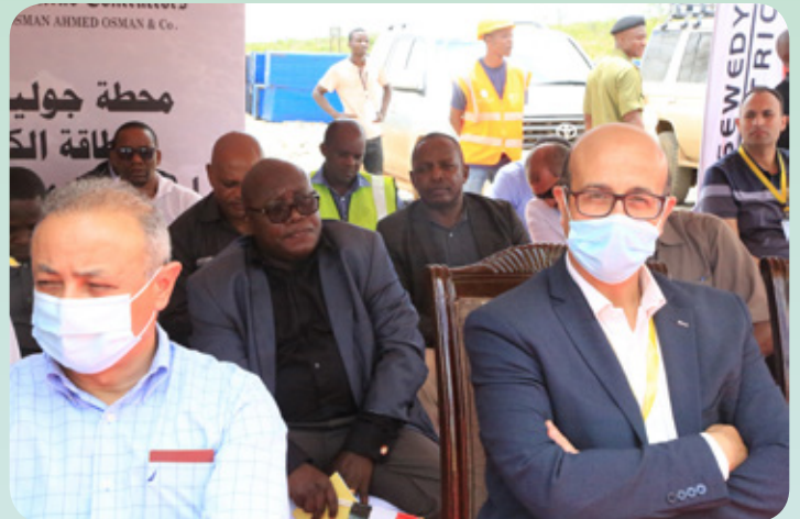
Baadhi ya Viongozi wakuu wa Wizara ya Nishati, wakimsikiliza Waziri Mkuu, Kassim Majaliwa wakati wa uzinduzi wa uchepushaji wa maji ya mto Rufiji kupitia handaki ili kuruhusu ujenzi wa tuta kuu katika mradi wa umeme wa Julius Nyerere (JNHPP).