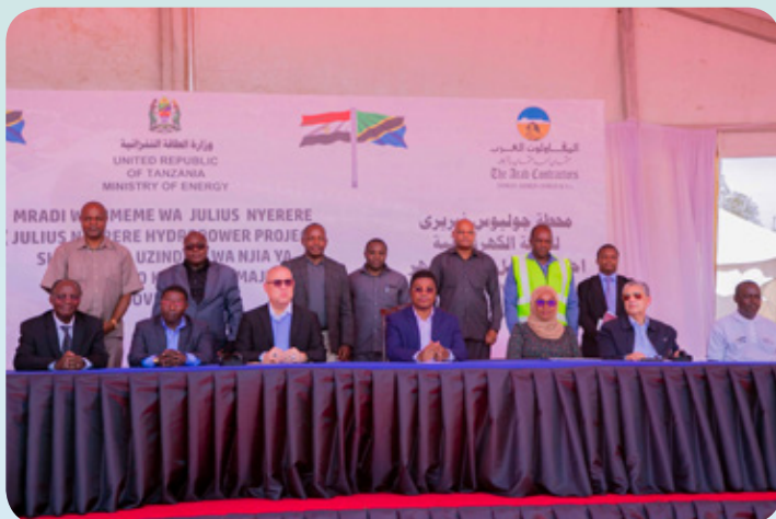
Baadhi ya Viongozi wakuu wa Wizara ya Nishati, (waliosimama) wakiwa katika picha ya pamoja na Waziri Mkuu, Kassim Majaliwa (waliokaa katikati) wakati wa uzinduzi wa uchepushaji wa maji ya mto Rufiji kupitia handaki ili kuruhusu ujenzi wa tuta kuu katika mradi wa umeme wa Julius Nyerere (JNHPP).