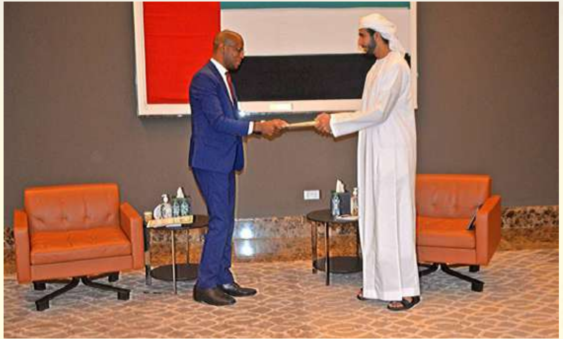
Waziri wa Nishati, January Makamba (kushoto) akiwasilisha ujumbe maalum wa Mhe. Samia Suluhu Hassan, Rais wa Jamhuri ya Muungano wa Tanzania kwenda kwa Mhe. Khalifa Bin Zayed Al Nahyan, Rais wa Umoja wa Falme za Kiarabu (UAE). Anayepokea ni Sheikh Shakhbout bin Nahyan Al Nahyan, Waziri wa Nchi anayeshughulikia mambo ya nje UAE.

Waziri Makamba aliwasilisha ujumbe huo maalum kupitia kwa Sheikh Shakhbout bin Nahyan Al Nahyan, Waziri wa Nchi anayeshughulikia