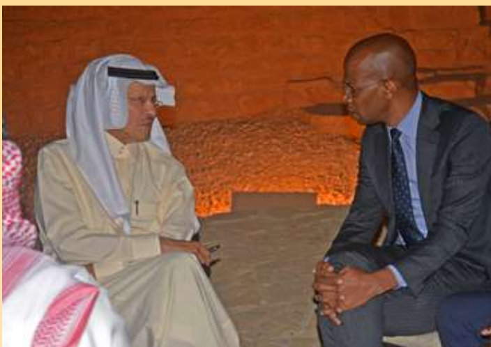
Waziri wa Nishati, January Makamba akizungumza na mwenyeji wake, Waziri wa Nishati wa Saudi Arabia Abdulaziz bin Salman Al Saud.

“Katika kuthibitisha hilo siku za hivi karibuni Waziri wa Mambo ya