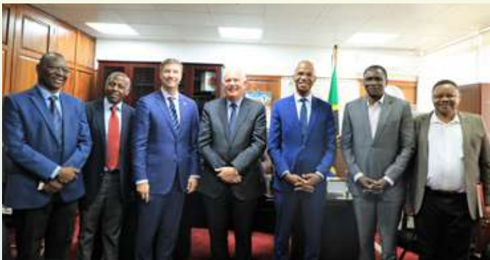
Waziri wa Nishati, January Makamba (Wa Tatu kulia) akiwa katika picha ya pamoja na Balozi wa Marekani nchini, Donald J. Wright (wa Nne kushoto) mara baada ya kumalizika kwa kikao kilichofanyika katika Ofisi ndogo za Wizara ya Nishati mkoani Dar es Salaam tarehe 08 Oktoba, 2021. Wengine katika picha ni Watendaji kutoka Wizara ya Nishati, Shirika la Maendeleo ya Petroli Tanzania (TPDC) na Ubalizi wa Marekani.