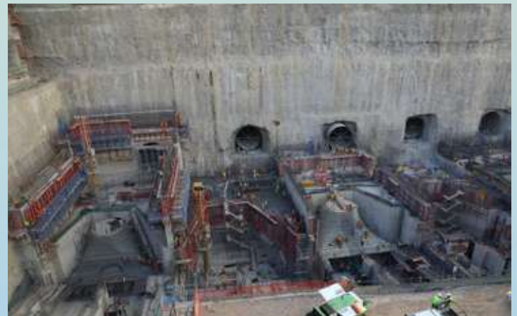
Kazi za ujenzi zikiendelea katika mradi wa umeme wa Julius Nyerere utakaozalisha umeme wa kiasi cha megawati 2115.