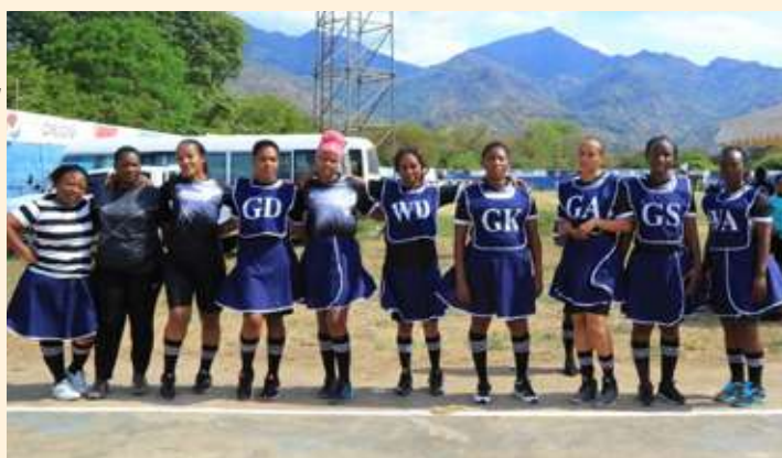
Wachezaji wa timu ya mpira wa Pete wa Wizara ya Nishati wakiwa tayari kwa Mashindano ya Shirikisho la Michezo ya Wizara na Taasisi na Idara za Serikali (SHIMIWI) katika hatua za Makundi dhidi ya Tume ya Walimu, Oktoba 21, 2021 katika uwanja wa Jamhuri mkoani Morogoro.

Michezo hiyo bado inaendelea hadi Novemba 2, 2021.