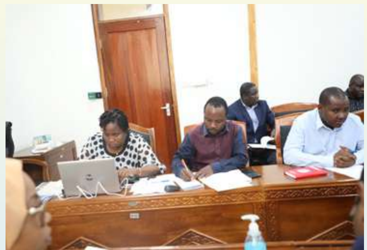
Picha mbalimbali za matukio katika kikao na baada ya kikao cha Ushirikiano baina ya Wizara ya Nishati ya Jamhuri ya Muungano wa Tanzania na Wizara ya Uchumi wa Buluu na Uvuvi ya Serikali ya Mapinduzi Zanzibar, kilichofanyika Oktoba 27, mwaka huu katika ofisi za Wizara ya Nishati zilizopo katika Mji wa Serikali jijini Dodoma.