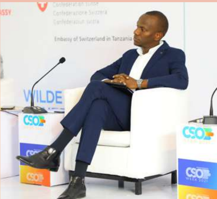
Naibu Waziri wa Nishati, Wakili Stephen Byabato akisikiliza mada mbalimbali zilizokuwa zikitolewa kwenye Warsha juu ya Sekta ya Uziduaji kwenye Madini, Mafuta na Gesi iliyoandaliwa na HakiRasilimali katika wiki ya Azaki 2021, iliyofanyika jijini Dodoma. Oktoba 25, 2021.

Wadau mbalimbali wakisikiliza mada mbalimbali ambazo zilikuwa zikitolewa kwenye Warsha juu ya Sekta ya Uziduaji kwenye Madini, Mafuta na Gesi iliyoandaliwa na HakiRasilimali katika wiki ya Azaki 2021, iliyofanyika jijini Dodoma. Oktoba 25, 2021.