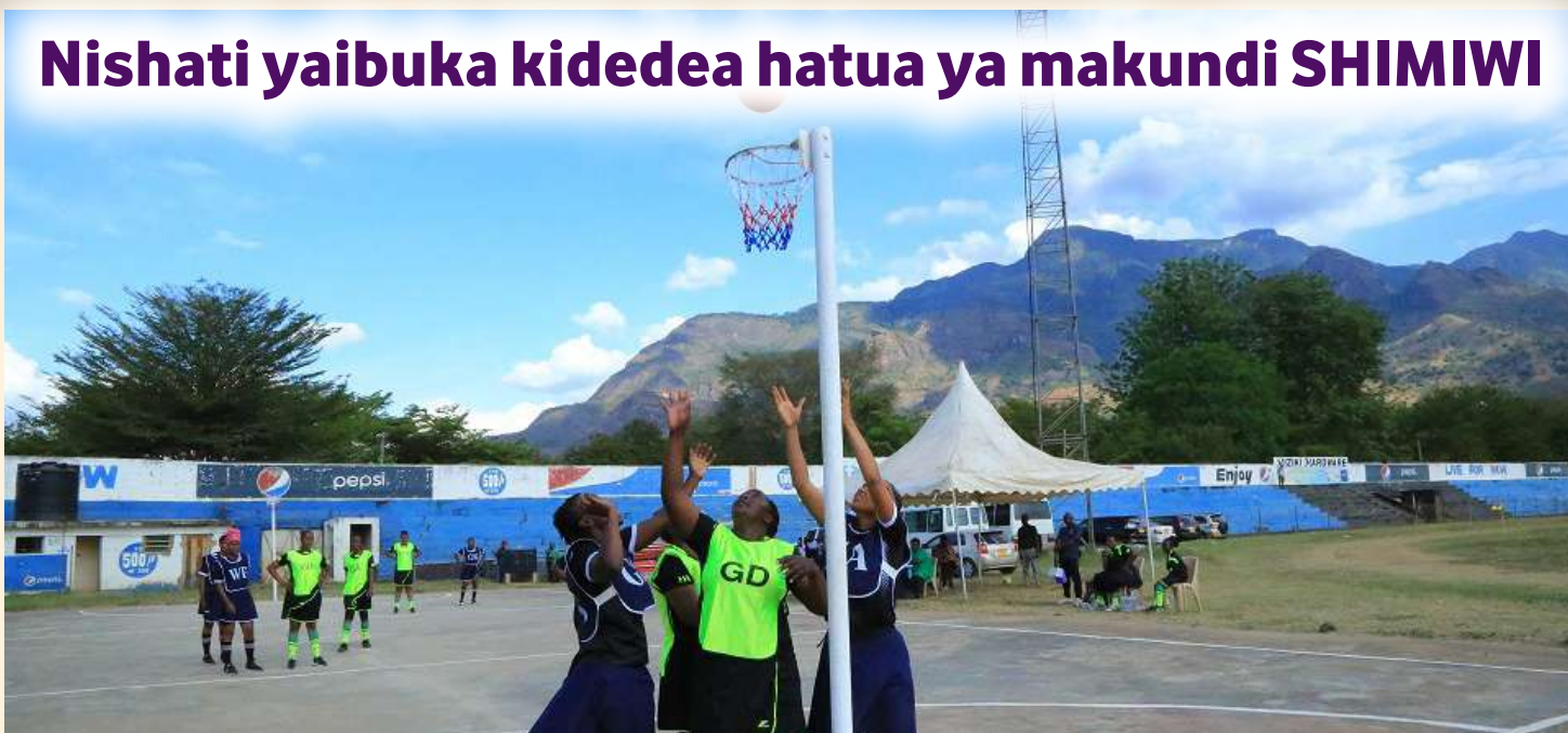
Wachezaji wa Timu ya Mpira wa Pete wa Wizara ya Nishati (wenye sare ya bluu) wakisubiria mpira waliorusha golini, katika Mashindano ya Shirikisho la Michezo ya Wizara na Taasisi na Idara za Serikali (SHIMIWI) katika hatua za Makundi dhidi ya Tume ya Walimu, Oktoba 21, 2021 katika uwanja wa Jamhuri mkoani Morogoro.