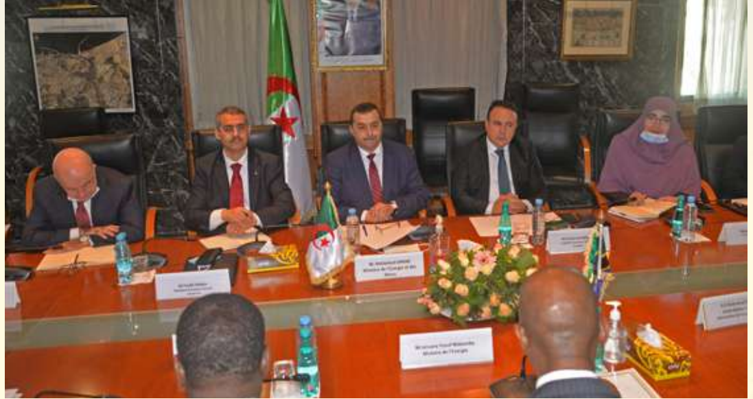
Waziri wa Nishati na Madini wa Algeria, Mohamed Arkab na timu yake wakisikiliza kwa makini mazungumzo ya timu ya Tanzania iliyoongozwa na Waziri wa Nishati, January Makamba