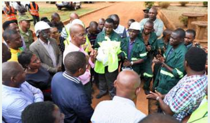
Waziri wa Nishati, January Makamba akizungumza na Wataalam kutoka TANESCO wanaofanya kazi katika Kituo cha kuzalisha umeme kilichopo wilayani Kasulu mkoani Kigoma wakati alipofika mkoani humo kutatua changamoto ya upatikanaji umeme wa uhakika.