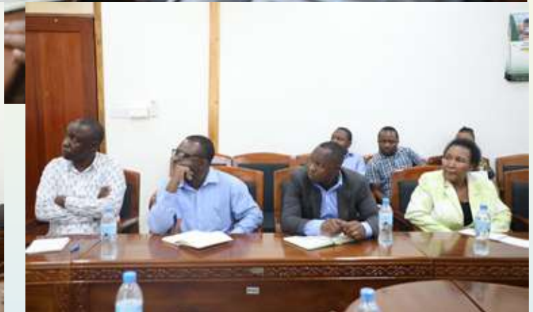
Picha mbalimbali za matukio kwenye kikao cha Wizara ya Nishati na Taasisi ya Natural Resource Governance Institute kilichofanyika katika ofisi za Wizara ya Nishati, zilizopo katika mji wa Serikali, jijini Dodoma