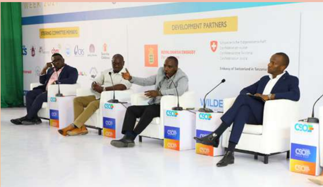
Naibu Waziri wa Nishati, Wakili Stephen Byabato (kwanza-kulia) akimsikiliza Waziri wa Madini, Doto Biteko (Pili-kulia) wakati akizungumza kwenye Warsha juu ya Sekta ya Uziduaji kwenye Madini, Mafuta na Gesi iliyoandaliwa na HakiRasilimali katika wiki ya Azaki 2021, iliyofanyika jijini Dodoma, Oktoba 25, 2021. Wa Tatu kutoka kulia ni Naibu Waziri wa Viwanda na Biashara, Exaud Kigaha.