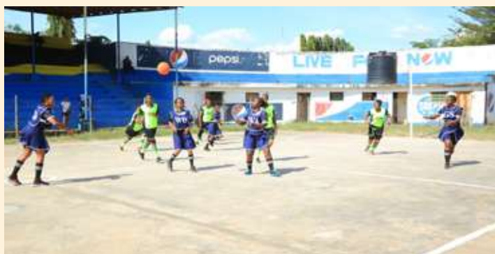
Wachezaji wa timu ya mpira wa Pete wa Wizara ya Nishati (wenye sare ya Bluu) wakicheza katika Mashindano ya Shirikisho la Michezo ya Wizara na Taasisi na Idara za Serikali (SHIMIWI) katika hatua za Makundi dhidi ya Tume ya Walimu, Oktoba 21, 2021 katika uwanja wa Jamhuri mkoani Morogoro.