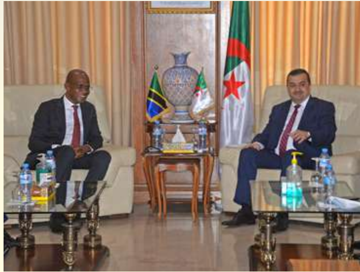
Waziri wa Nishati, January Makamba akifuraha jambo baada ya kukutana na Waziri wa Nishati na Madini wa Algeria, Mohamed Arkab, tarehe 28 Oktoba 2021.

Katika mazungumzo hayo, Waziri Makamba alieleza mahusiano ya kihistoria yaliyopo baina ya Tanzania na Algeria na kueleza nia ya Serikali ya Tanzania kuendeleza mahusiano hayo katika nyanja ya uchumi kwa