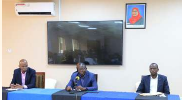
Makamu wa Rais wa Jamhuri ya Muungano wa Tanzania, Mhe. Philip Isdor Mpango (katikati) akizungumza wakati wa kikao cha majumuisho mara baada ya kumaliza ziara yake katika mradi wa Umeme wa Julius Nyerere. Kushoto ni Waziri wa Nishati, January Makamba na kulia ni Naibu Waziri wa Nishati, Wakili Stephen Byabato.

Baadhi ya maelekezo yake ni kuwa, Katibu Mkuu Kiongozi ateue timu ya wataalam kutoka Wizara mbalimbali, baadhi ya Taasisi za Serikali na vyombo vya Ulinzi na Usalama itakayochambua