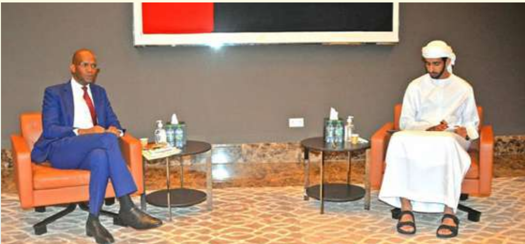
Waziri wa Nishati, January Makamba (kushoto) akizungumza na Sheikh Shakhbout bin Nahyan Al Nahyan, Waziri wa Nchi anayeshughulikia mambo ya nje katika Umoja wa Falme za Kiarabu (UAE) wakati Waziri Makamba alipofika nchini humo akiwa na ujumbe Maalum wa Mhe. Samia Suluhu Hassan, Rais wa Jamhuri ya Muungano wa Tanzania kwenda kwa Mhe. Khalifa Bin Zayed Al Nahyan, Rais wa Umoja wa Falme za Kiarabu (UAE).