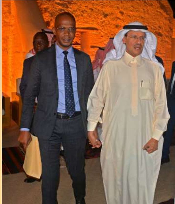
Waziri wa Nishati, January Makamba akiongozana na mwenyeji wake ambaye ni Waziri wa Nishati wa Saudi Arabia, Abdulaziz bin Salman Al Saud mara baada ya kumaliza kikao chao kilicholenga kudumisha uhusiano katika sekta ya nishati na kuwasilisha ujumbe wa Rais Samia kwa Serikali ya Saudi Arabia.

Katika kikao hicho, Waziri Makamba alijadiliana masuala mbalimbali yahasuyo nishati na Waziri mwenzake na pia aliwasilisha ujumbe maalumu kutoka kwa Rais wa Jamhuri ya Muungano wa Tanzania, Mhe. Samia Suluhu Hassan kwa Serikali ya